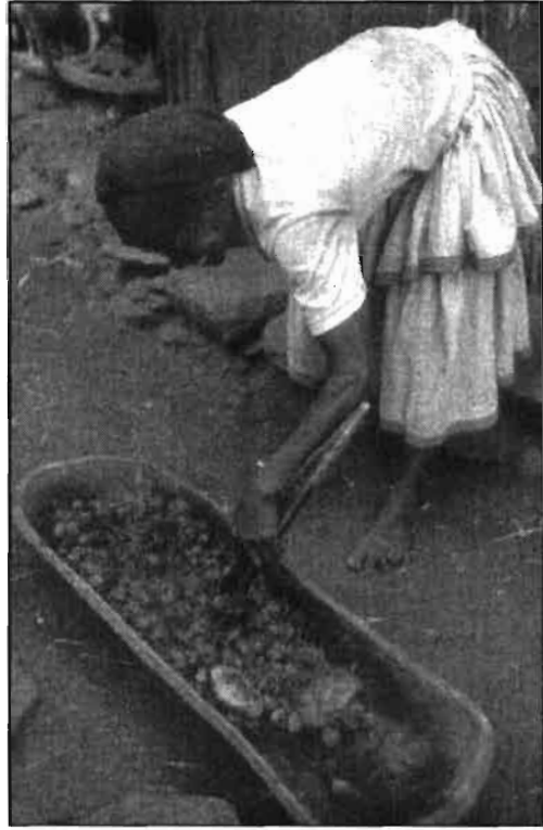
Figure 4 La préparation de la dama .

plantes cultivées dont les feuilles ne sont qu'accessoirement consommées (par exemple la tomate, Lycopersicon esculentum Miller). De plus, à l'exception de Balanites aegyptica (L.) Del. et de Moringa stenopetala , ce sont toutes des herbacées. Elles sont employées, selon la phénologie et les qualités gustatives de l'espèce, en saison sèche seulement ou tout au long de l'année, seules ou en mélange.