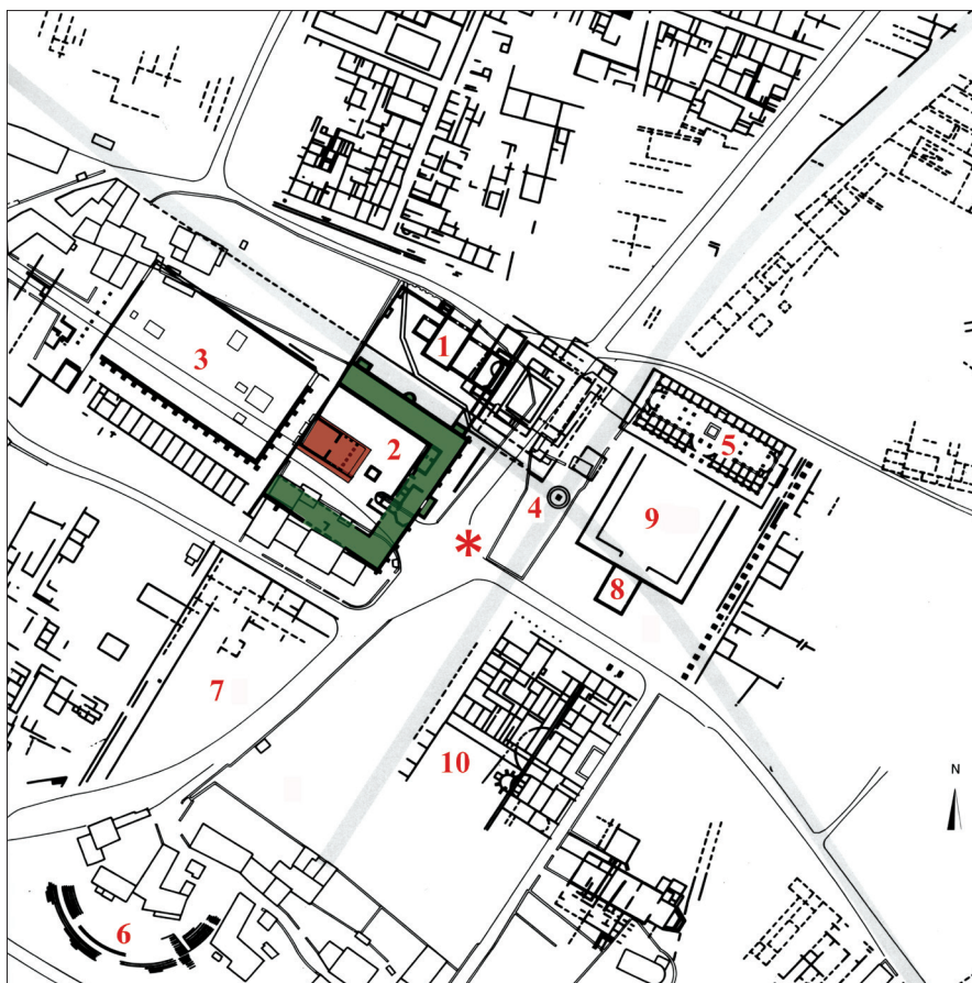
Fig. 1. Le centre monumental de Saint-Bertrand-de-Comminges antique d'après J.-L. Paillet. 1. Thermes du Forum ; 2. Temple du Forum ; 3. Forum ; 4. Monument circulaire ; 5. Macellum ; 6. Théâtre ; 7. Portique du théâtre ; 8. Temple ; 9. Place et portique du marché ; 10. Grande demeure (Badie et al. 1994, 137, fig. 133).

Robert Sablayrolles a bien montré (fig. 1) comment ce temple présente l'originalité de tourner le dos au forum et de s'ouvrir vers l'est sur une place 1 qui était un "élément essentiel de la vie urbaine, aussi important que le forum " 2 . Constituée au cours du 1 er s. p.C. autour du monument à enceinte circulaire qui rappelait le souvenir du carrefour des voies romaines