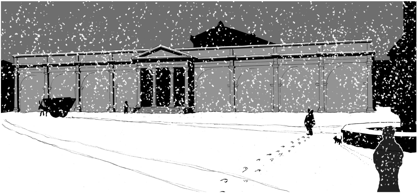
Fig. 6. Évocation enneigée du portique du temple du forum .