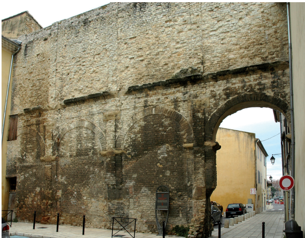
Fig. 5. Orange, “le mur Pontillac”.