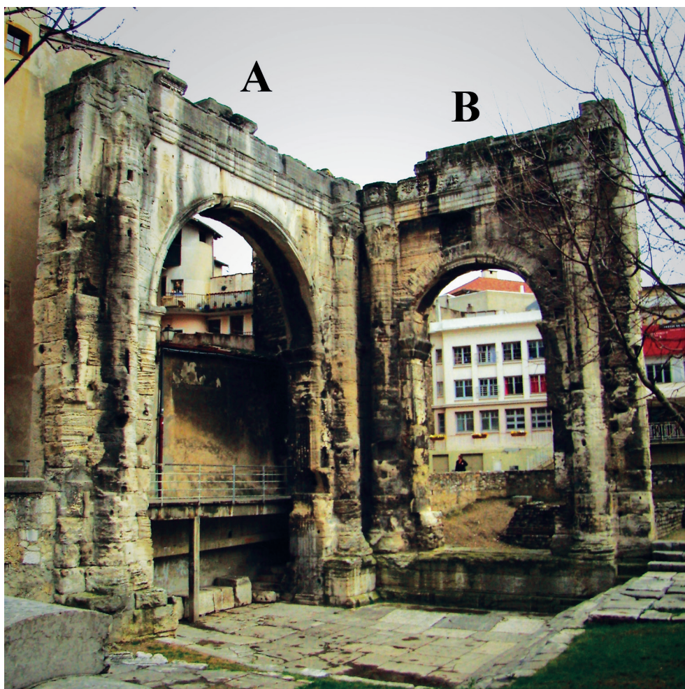
Fig. 4. Vienne : "les arcades du forum ".

Toujours en Narbonnaise, les "arcades du forum " 15 de Vienne (Isère) forment en plan un angle droit. L'élévation de l'arcade A (fig. 4) signale une entrée latérale du forum qui se développait devant le temple d'Auguste et Livie. Il ne s'agit donc pas à proprement parler de la façade du portique qui entourait le temple. Un arc est encadré par deux demi-colonnes corinthiennes engagées supportant un entablement à décrochements dont la frise est lisse. L'arcade B appartient à la façade d'un autre bâtiment dont la fonction exacte est discutée, mais qui développe un ordonnancement comparable enrichi par une frise à rinceau et des têtes à la verticale des demi-colonnes, sur les ressauts. L'arcade B serait la plus ancienne (d'époque julio-claudienne), l'arcade A plus récente (d'époque flavienne). L'ensemble est construit en grand appareil.