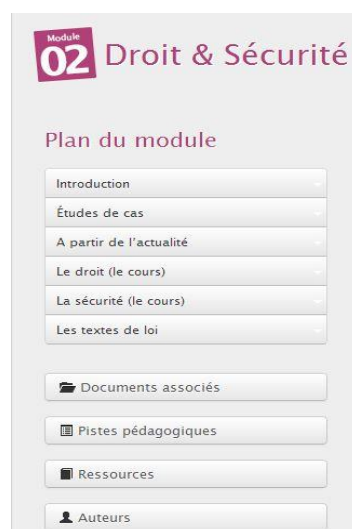
Figure I. A Partir de l'actualité dans le module

Nous poursuivrons notre réflexion en évoquant les conditions d'efficacité d'une telle formation. Nous préciserons la distance non négligeable que l'on peut mesurer entre l'existant et ce qui en ferait une formation nécessaire (Frau-Meigs, 2011). Nous identifierons les facteurs qui font obstacle à une telle mise en œuvre, en nous appuyant sur une approche communicationnelle et sur le cadre théorique de l'action conjointe en didactique (Sensevy, 2011). Cela sera fait, d'un point de vue méthodologique en considérant les critiques des étudiants à propos des exemples proposés. Il sera alors temps, à la lueur des résultats obtenus, d'adopter un point de vue interculturel.