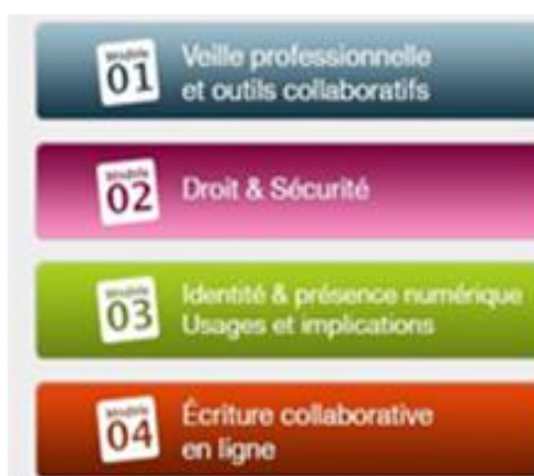
Figure II. Les 4 modules

Ce cours est né d'une commande d'un pôle de recherche et d'enseignement (PRES) : l'Université européenne de Bretagne. C'est l'Université Rennes 2 et son centre de ressources et d'études audiovisuelles qui a été chargée, en 2013, de son exécution. Ils ont fait appel à des enseignants qui, pour une large part, appartiennent au groupe de recherche sur la culture et la didactique de l'information (GRCDI) à qui a promu en France l'idée de la translittératie.