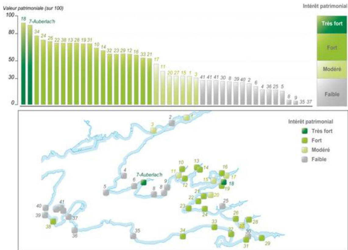
Figure 2. Classement des sites en fonction de leur valeur patrimoniale.

cordons, la détérioration des habitats et le dérangement de l'avifaune. Cette pression est très forte en rade où de nombreuses cales permettent aux véhicules motorisés d'accéder facilement à l'estran. La création récente de nouveaux sentiers côtiers de randonnées dans des secteurs jusqu'à présent peu fréquentés pose également question.