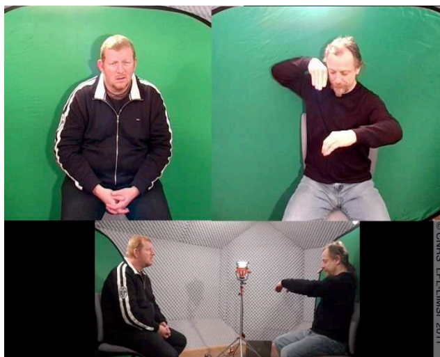
Figure 3 : Arrêt sur image de l'unité « avant la descente », 00 :18.800 (locuteur 2, à droite) , corpus DEGELS1, Boutora & Braffort 2011.

L'annotation reflète bien sûr l'analyse faite par le chercheur. Sa semi-automatisation astreint toutefois à une grande rigueur dans la catégorisation et à des choix conséquents de valeurs. Elle facilite à ce titre l'identification des cas problématiques. Nous voudrions illustrer ce point par une courte discussion concernant un exemple du corpus qui nous a posé question et qui reflète à lui seul la difficulté et l'intérêt d'analyser finement les pointages en LSF. Il s'agit de l'unité que nous avons glosée par « avant la descente » (timer : 00:18.800). Nous avons fait le choix de la coder comme un pointage dans une zone de l'espace. Elle peut tout aussi bien être analysée comme un transfert situationnel, dont elle présente toutes les caractéristiques (mouvement dynamique de la main dominante, locatif par la main dominée, regard et mimique faciale accompagnant le mouvement de la main dominante). Il est probable qu'elle soit, en fait, un mixte de ces deux catégories. Ce genre d'unité nous interroge sur les frontières de ce que l'on considère comme un pointage et fonde la nécessité de maintenir une piste « commentaire ».