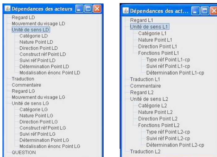
Figure 2 : Représentations du schéma d’annotation intermédiaire (partie gauche) et du schéma d’annotation final (partie droite)

On peut considérer, a posteriori , que le schéma d’annotation a subi trois étapes majeures d’évolution avant d’apparaître dans sa version actuelle. Les changements ont concerné avant tout les pistes relatives aux pointages.