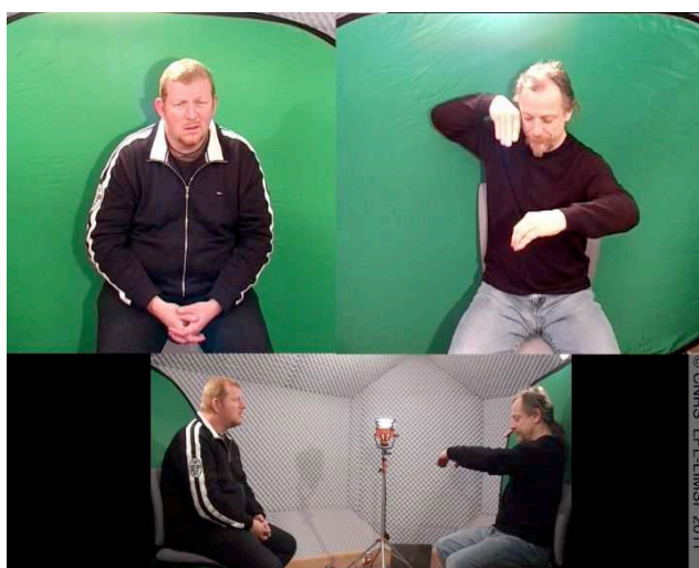
Figure 3 : Arrêt sur image de l'unité « avant la descente », 00 :18.800 (locuteur 2, à droite) , corpus DEGELS1, Boutora & Braffort 2011.

L'annotation reflète bien sûr l'analyse faite par le chercheur. Sa semi-automatisation astreint toutefois à une grande rigueur dans la catégorisation et à des choix conséquents de valeurs. Elle facilite à ce titre l'identification des cas problématiques. Nous voudrions illustrer ce point par une courte discussion concernant un exemple du corpus qui nous a posé question et qui reflète à lui seul la difficulté et l'intérêt d'analyser finement les pointages en LSF. Il s'agit de l'unité que nous avons glosée par « avant la descente » (timer : 00:18.800). Nous avons fait le choix de la coder comme un pointage dans une zone de l'espace. Elle peut tout aussi bien être analysée comme un transfert situationnel, dont elle présente toutes les caractéristiques (mouvement dynamique de la main dominante, locatif par la main dominée, regard et mimique faciale accompagnant le mouvement de la main dominante). Il est probable qu'elle soit, en fait, un mixte de ces deux catégories. Ce genre d'unité nous interroge sur les frontières de ce que l'on considère comme un pointage et fonde la nécessité de maintenir une piste « commentaire ».