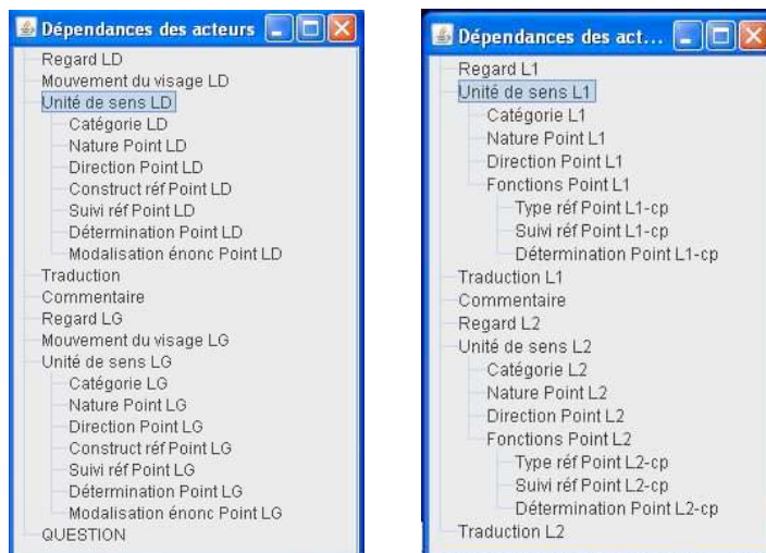
Figure 2 : Représentations du schéma d’annotation intermédiaire (partie gauche) et du schéma d’annotation final (partie droite)

On peut considérer, a posteriori , que le schéma d’annotation a subi trois étapes majeures d’évolution avant d’apparaître dans sa version actuelle. Les changements ont concerné avant tout les pistes relatives aux pointages.