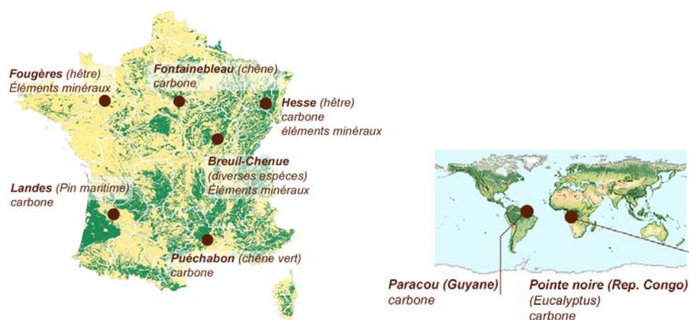
Figure 1 : localisation des sites-ateliers et mention de l'espèce dominante et de la thématique principale

Le réseau RENECOFOR constitue un réseau de « suivi intensif » à long terme de l'évolution des principaux types de peuplements forestiers de France métropolitaine (partie française du réseau européen dit de « niveau 2 » du dispositif de suivi des forêts). Avec une centaine de sites en France métropolitaine, il ne couvre pas de façon statistique la diversité des conditions naturelles des forêts françaises, mais constitue un référentiel précieux qui permet de resituer les sites-ateliers dans un contexte plus large et, dans certains cas, de « généraliser » les résultats obtenus dans les sites-ateliers. Tout un ensemble de paramètres écologiques sont en effet commun à ce réseau et aux sites-ateliers. En outre RENECOFOR apporte une contribution intéressante dans le domaine de la pollution atmosphérique qui fait également l'objet de suivis plus ou moins exploratoires dans les sites-ateliers.