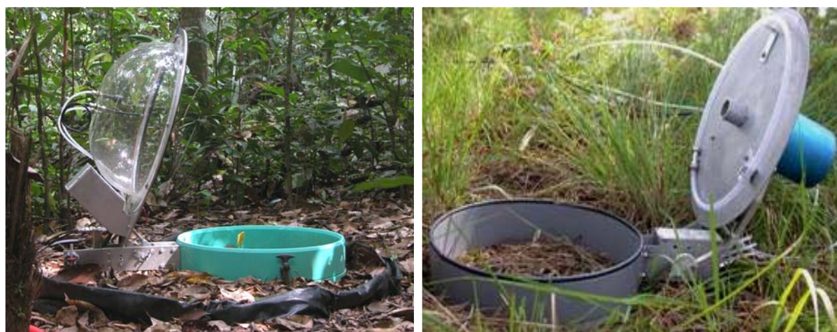
Photos 1 : chambres in situ des systèmes SAMERESO (gauche, diamètre interne 52 cm) et ADOC (droite, diamètre interne 30 cm)

Mots clés : CO 2 , variabilité temporelle, automatisation, comparaison méthodologique