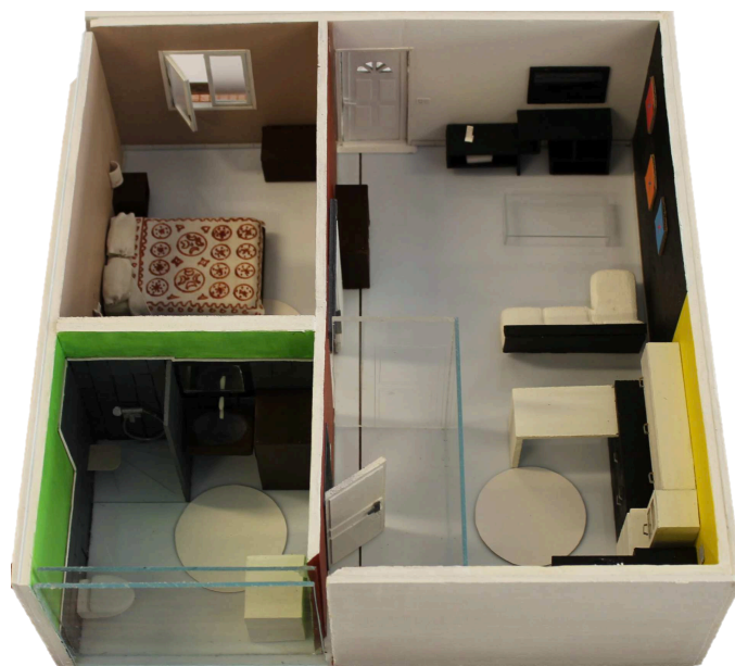
Fig. 1. Illustration 3D de la plateforme technique

La figure 1 présente la plateforme technique dans son ensemble qui est constituée de deux entrées dont une pourvue d'un sas de 4 m 2 , un séjour de 16 m 2 , une cuisine ouverte de 9 m 2 , une chambre de 12 m 2 , une salle d'eau avec cabinet d'aisances de 8 m 2 .