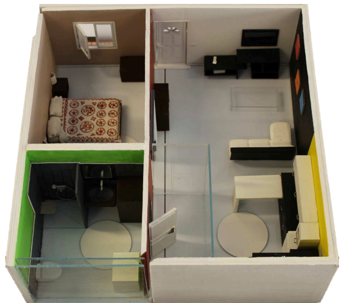
Fig. 1. Illustration 3D de la plateforme technique

La figure 1 présente la plateforme technique dans son ensemble qui est constituée de deux entrées dont une pourvue d'un sas de 4 m 2 , un séjour de 16 m 2 , une cuisine ouverte de 9 m 2 , une chambre de 12 m 2 , une salle d'eau avec cabinet d'aisances de 8 m 2 .