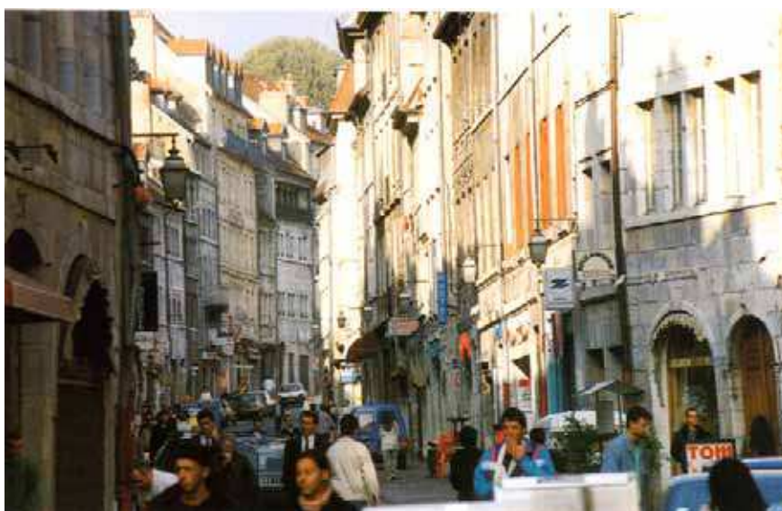
La rue Battant (cliché : Gabriel Vieille)

Le XIX e siècle et le début du XX e ont vu une densification du bâti, en liaison avec l'industrie horlogère (multiplication des petits ateliers dans les cours) et une réelle surcharge démographique qui ont petit à petit amené une dégradation du cadre urbain. Cette évolution, qui s'est poursuivie après la Seconde Guerre mondiale, a entraîné une taudification de certains îlots. Votée en 1962, la loi Malraux a permis