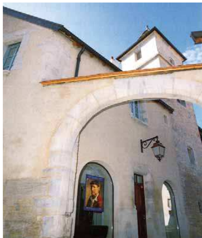
L'hôtel Jouffroy avant et après rénovation