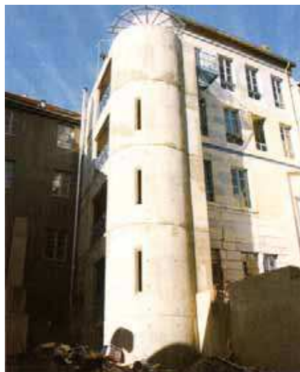
L'îlot de la Madeleine avant et après rénovation