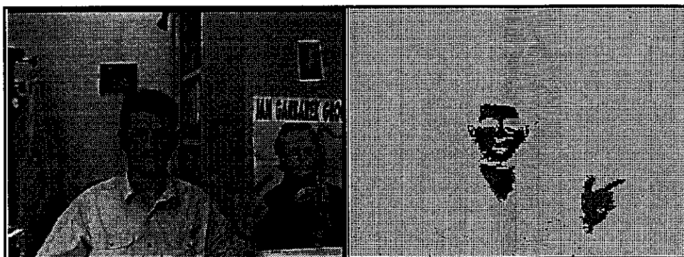
Figure 1 : Détection de la teinte chair : image d'origine et image après détection.

Cependant, il n'est pas possible d'appliquer le réseau de neurones, en temps réel, à toute l'image CIF traitée, sans informations a priori. Nous avons donc développé des modules de détection de mouvement et de teintes chairs [6] pour identifier des régions d'intérêt où sont susceptibles de se trouver des visages. Ces régions correspondent principalement aux couples visages/cous et mains/bras.