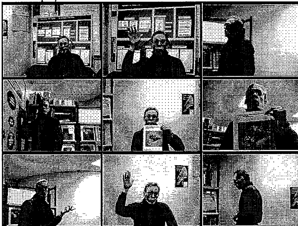
Figure 3 : La prise de vue réalisée par LISTEN au cours d'une communication visiophonique " personne libre ".

L'observateur perçoit correctement le signal de parole ainsi que les variations d'intensité associées aux déplacements d'avant en arrière du participant distant. On constate que le niveau subjectif de perception de la parole semble supérieur à l'amplitude physique (inversement proportionnelle au carré de la distance). Ce phénomène peut s'expliquer par le fait que l'observateur compense partiellement la baisse du signal en voyant l'utilisateur s'éloigner. Ainsi, l'image et le son sont subjectivement perçus comme cohérents.