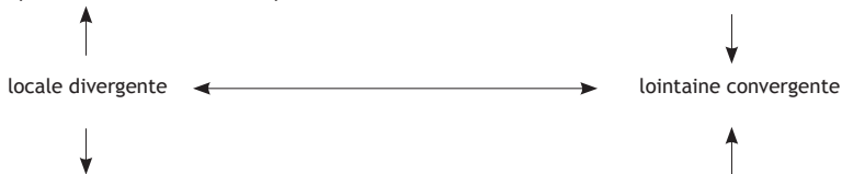
Figure 2 : Représentations de l'intercompréhension en fonction de la distance

Dans le troisième schéma (figure 3), la compétence (+ ou -) symbolise le fait que l'on peut manifester ou revendiquer une identité supra locale à travers l'affirmation de la compréhension d'une langue que l'on connaît peu, voire pas (ex : l'arabe littéraire), alors que l'identité locale est manifestée ou revendiquée à travers de l'affirmation de la non compréhension des vernaculaires voisins.