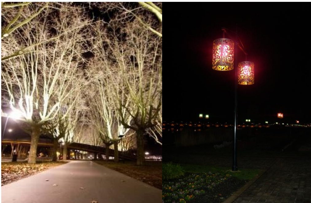
Figure n°5 Eclairage quotidien des berges des quais

Les quais s’animent également suivant les saisons. C’est en effet le lieu privilégié pour les promenades des Bordelais et des touristes dès le printemps. Rénovés récemment après des années d’abandon, la réhabilitation de cet espace est complète dans le périmètre classé UNESCO. Les façades ont retrouvé leur blancheur d’antan et côté berges, les aménagements ont donné des fonctions différentes tout le long des 4,5km. Les hangars au nord abritent désormais commerces, bars, restaurants et Cap Science, puis en allant vers le sud, on retrouve des aires de jeux pour enfants, un skate parc, une grande pelouse arborée, des parterres fleuris, le miroir d’eau et des installations sportives de plein air, le tout longé d’un côté par la promenade et de l’autre par une piste cyclable. Si l’éclairage nocturne y est discret en termes d’intensité lumineuse, il n’en reste pas moins très travaillé. Les lampadaires classiques ont été remplacés par des sortes de lampions diffusant un éclairage coloré vert et rose et des projecteurs éclairent le branchage des arbres sur la pelouse offrant ainsi des jeux d’ombres et de lumières aux passants (figure n°5). Les terrains de sports et le skate parc sont quant à eux dotés d’un éclairage plus classique jusqu’à 22h.