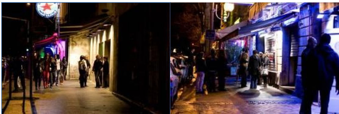
Figure n°6 Le quai de Paludate, l'éclairage provient des néons des discothèques (Clichés J. Cazzulo, octobre 2009)

La lumière n'est pas qu'artificielle, la lumière naturelle joue aussi un rôle dans la mise en beauté de la ville. Cette lumière peut être sublimée par certains aménagements, c'est le cas lorsque les façades en pierre blonde de Gironde sont ravalées. Il s'agit des quartiers traditionnellement bourgeois, tel le triangle d'or bordelais et des quartiers plus récemment gentrifiés comme Saint Pierre. Certains quartiers sont en passe de s'anoblir, le quartier Saint Michel est l'exemple le plus flagrant en ce moment, il est l'objet d'une réhabilitation menée par la mairie, une société d'économie mixte, In Cité et des promoteurs privés. Comme pour Saint Pierre quelques années plus tôt, les-immeubles et façades sont rénovés et des espaces