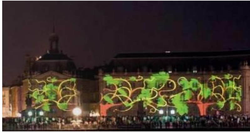
Fig. n°4 Projection sur la façade de la place de la Bourse lors de la fête du vin en juin 2010

Les quais s’animent également suivant les saisons. C’est en effet le lieu privilégié pour les promenades des Bordelais et des touristes dès le printemps. Rénovés récemment après des années d’abandon, la réhabilitation de cet espace est complète dans le périmètre classé UNESCO. Les façades ont retrouvé leur blancheur d’antan et côté berges, les aménagements ont donné des fonctions différentes tout le long des 4,5km. Les hangars au nord abritent désormais commerces, bars, restaurants et Cap Science, puis en allant vers le sud, on retrouve des aires de jeux pour enfants, un skate parc, une grande pelouse arborée, des parterres fleuris, le miroir d’eau et des installations sportives de plein air, le tout longé d’un côté par la promenade et de l’autre par une piste cyclable. Si l’éclairage nocturne y est discret en termes d’intensité lumineuse, il n’en reste pas moins très travaillé. Les lampadaires classiques ont été remplacés par des sortes de lampions diffusant un éclairage coloré vert et rose et des projecteurs éclairent le branchage des arbres sur la pelouse offrant ainsi des jeux d’ombres et de lumières aux passants (figure n°5). Les terrains de sports et le skate parc sont quant à eux dotés d’un éclairage plus classique jusqu’à 22h.