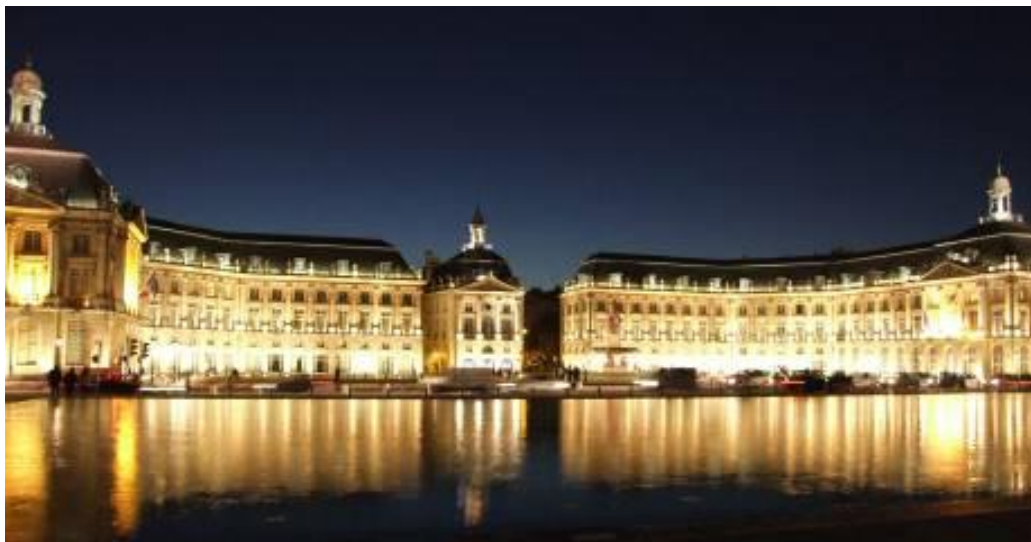
Fig. n°3 Illuminations du quotidien sur la façade de la place de la Bourse

Au quotidien, le plus gros effort en matière de mise en lumière revient à la place de la bourse, les photographies de nuit de cette façade sont très fréquemment utilisées pour la promotion de la ville ou sur les cartes postales (fig. n°3). Lorsque des événements culturels ont lieu sur les quais, cette façade est illuminée selon le thème par des artistes concepteurs-lumière. Des projections ont lieu régulièrement (fig. n°4). C'est le cas au début de l'été pour la fête du vin ou la fête du fleuve, ces deux événements se déroulant en alternance d'une année sur l'autre. Pour l'édition 2010, la fête du vin a répondu aux attentes des visiteurs. Des spectacles « son et lumière » ont eu lieu tous les soirs à partir de 23h, la façade devient alors un écran géant de près de 4000m 2 . A partir de 23h30, il faut se retourner pour assister à la fin du spectacle et faire face à la Garonne au dessus de laquelle les soirées se terminent par un feu d'artifice. Chaque soir, il est d'une couleur différente (rouge, blanc, rose et or, les couleurs des vins de Bordeaux). Cette manifestation a attiré plus de 500 000 visiteurs en juin 2010, dont beaucoup d'amateurs de vin du monde entier et nombre de professionnels. En revanche, pas de restrictions budgétaires pour cette manifestation, la mairie y a consacré 2,5 millions d'euros. Comme pour les illuminations de Noël, cette somme est en fait un investissement car les retombées économiques de la fête du vin sont estimées à environ 20 millions d'euros.