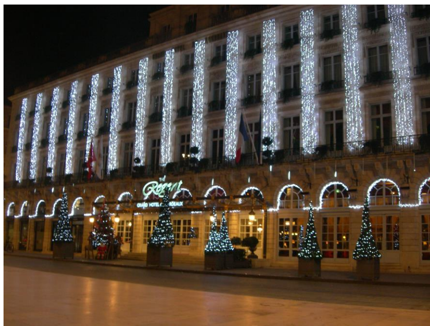
Fig. n°2-Le Regent, Grand hôtel de Bordeaux mis en lumière à l'occasion des fêtes de fin d'années, place de la comédie.