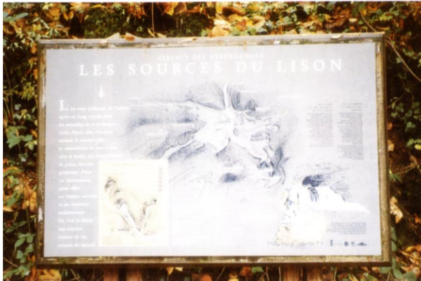
Le thème de l'eau à travers les résurgences.

La mise en place d'un sentier d'interprétation relève, dans la très grande majorité des cas, d'initiatives locales : municipalités, structures intercommunales, parcs régionaux, conseils généraux, mais aussi monde associatif. La conception même du sentier, sa thématique, son tracé, son contenu scientifique ainsi que la définition des modes de transmission de l'information peuvent être définis par le promoteur de l'opération, mais cette tâche a souvent été déléguée au CPIE du Haut-Doubs. Même si la plupart des sentiers sont relativement courts — la très grande majorité ne dépasse pas 4 à 5 km pour