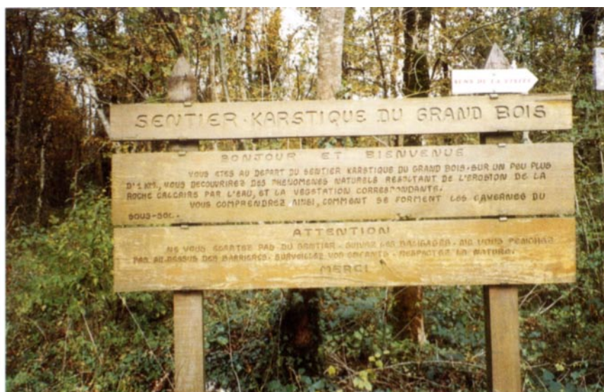
Informations et recommandations, un exemple à Mérey-sous-Montrond.

L'importance du thème de l'eau peut surprendre dans une région où le réseau hydrographique est, dans l'ensemble, peu abondant. Mais l'infiltration des eaux superficielles et la création de réseaux souterrains dans la masse des terrains calcaires ont contribué à l'édification de systèmes de drainage particulièrement originaux et complexes dont témoignent les nombreuses grottes et sources karstiques (sources du Doubs, de l'Ain, de la Loue, du Lison...), mais aussi vallées encaissées, gorges et cascades qui accidentent le cours des riviè-