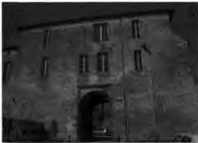
Photo 1 : Forteresse de Blaye en Gironde, l'étude au niveau maçonnerie portera sur la Porte de Liverneuf. Une partie sera équipée de capteur pour connaître l'effet de l'atmosphère sur les pierres.

Les méthodes de protection et de réparation seront aussi testées afin de prévoir (soit empiriquement soit par la modélisation) l'effet des interventions sur la structure.