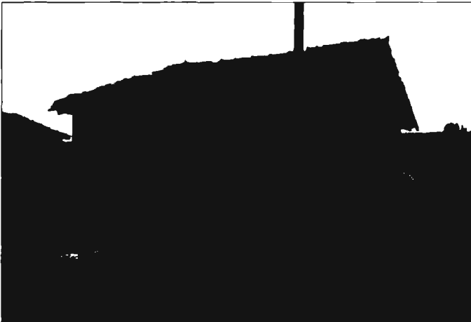
Photo 4 : Cabanon en bois typique du port ostréicole de Gujan Mestras. Pour des raisons de sécurité une cabane en mauvais état doit être détruite. Pour des raisons d'ordre touristique, il faudrait les conserver. L'enjeu de l'étude est d'évaluer l'état de la cabane et d'en déduire les risques associés à sa conservation.

L'objectif est ici à partir de structures existantes sur le domaine maritime de Gironde au moins pour l'une d'entre elles. Une bibliographie sur les cinétiques de dégradation et sur les moyens de protection sera réalisée, et mise sur le site web. Une étude des moyens de mesures applicables au bois permettant de retrouver l'état réel de la structure a commencé. Le développement d'un modèle de chaque structure étudié permettra de simuler le vieillissement de la structure ou de vérifier sa dangerosité (au sens du risque d'effondrement sur un hôte de passage). Dans le cas du premier exemple traité (cabane ostréicole) les tests sur les matériaux après démolition permettront de valider une partie de la démarche, en particulier l'estimation de l'état réel de la structure.