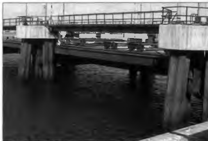
Photo 3 : Peniche est un port sur la côte portugaise. La structure étudiée ici sert à mettre hors eau les bateaux pour en faire la maintenance. Dans ce cas on s'intéresse à l'état de corrosion de la structure, et aux risques induits par la dégradation de l'ouvrage à plus ou moins long terme.

L'objectif est ici à partir de structures existantes immergées, ou en zone de marnage dans les ports de Nantes-Saint-Nazaire et de Bordeaux. La démarche va consister en l'étude des cinétiques de corrosion en fonction des milieux, puis l'insertion de ces cinétiques dans un modèle va permettre de prévoir l'évolution dans le temps des structures étudiées.