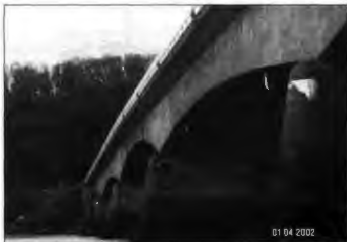
Photo 2 : Le pont de Younghaon Irlande est un pont en béton armé. Il sera un des supports pour l'étude de fiabilité et de maintenance des ouvrages en béton armé.

L'objectif final est de mieux cerner la durée de vie effective d'une structure en béton armé, d'établir des protocoles pour l'évaluation des méthodes de protection et de réparation, et d'avancer sur des règles de conceptions pour des structures en mer. On va donc réaliser des essais afin de trouver des relations entre les résultats des essais utilisés dans les divers laboratoires et aussi avec les phénomènes réels. Par la suite on étudiera l'influence de différents paramètres : humidité extérieure, température (la température, le degré d'hygrométrie moyens ne sont pas les mêmes entre le nord et le sud de l'Arc Atlantique), taux d'ions chlorure, degré de microfissuration, etc. Les méthodes de réparation et de protection seront aussi testées dans le but de connaître leur efficacité et leur durabilité.