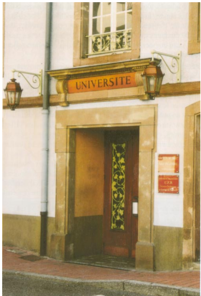
Porche d'entrée d'un des sites de l'UFR STGI à Belfort

Cette délocalisation vers le Nord Franche-Comté a vu le jour grâce aux volontés conjuguées de nombreux acteurs. Les élus des municipalités de Belfort et de Montbéliard, du District urbain du Pays de Montbéliard (DUPM) et du conseil général du Territoire de Belfort se révèlent être les principaux instigateurs de l'UFR STGI. En effet, leur entrée au conseil d'administration de l'Université coïncide avec le début des négociations relatives à l'ouverture d'une antenne dans la partie septentrionale de la région. Ainsi, malgré les craintes d'une concurrence économique et l'affaiblissement de l'image