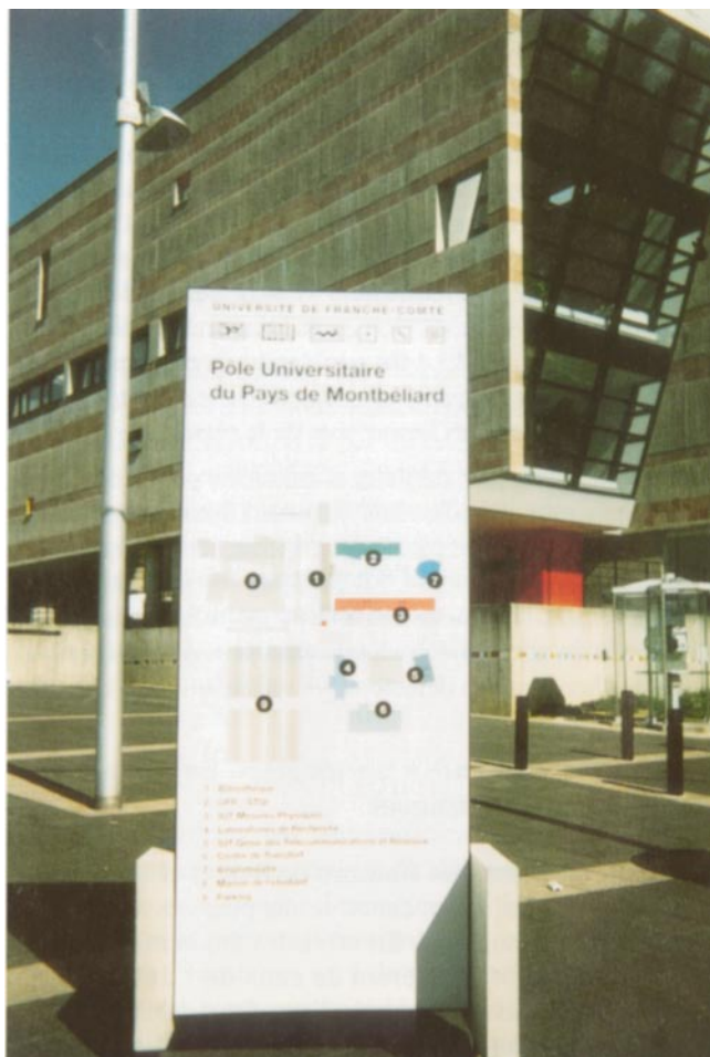
Présentation du pôle universitaire du Pays de Montbéliard.

de marque de la capitale régionale, les élus bisontins n'ont pas été en mesure de s'opposer à cette délocalisation. La Région de Franche-Comté a même pris part au financement de ces bâtiments.