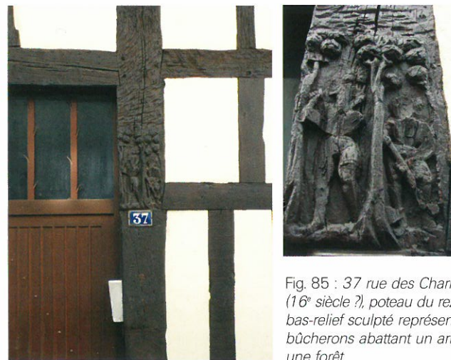
Fig. 85 : 37 rue des Charretiers (16 e siècle ?), poteau du rez-de-chaussée, bas-relief sculpté représentant deux bûcherons abattant un arbre dans une forêt

Peu de temps après l'abattage, on pratiquait l'équarrissage sur le lieu de coupe, opération qui consistait à passer de la section circulaire à la section rectangulaire par enlèvement de l'écorce, de l'aubier et parfois d'une partie du bois de cœur. Les charpentiers ou les bûcherons (fig. 85) spécialisés utilisaient alors une herminette ou une hache (hache à blanchir, cognée, doloire) 10 . Ensuite, le débitage servait à diviser la grume. Il pouvait être minimal lorsqu'on voulait du bois de brin, c'est-à-dire un tronc simplement équarri, non divisé en longueur où le cœur se trouve au centre de la pièce. Le débitage sur quartier, consiste à diviser la bille de bois équarrie en deux ou quatre pièces (HUNOT 2001 : p. 38-45).