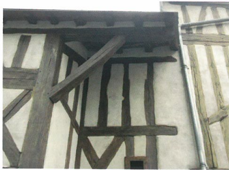
Fig. 87 : 9 rue Guichet-Saint-Benoît, auvent formé par le prolongement du toit.

d'entretien et de transformation de l'édifice. L'étude des maisons a montré plusieurs exemples de façades dont les niveaux supérieurs avaient subi des phases de remaniements datées par dendrochronologie de la fin du Moyen-Age ou de l'époque moderne. Dans certains cas, ces transformations correspondent à des exhaussements de maison, opérations assez courantes si l'on en croit les clauses de plusieurs baux à rente qui imposaient aux preneurs de faire « haulser d'un estai » leur maison. Il est parfois précisé que ces exhaussements devront se faire à l'aplomb (« de pié droit ») (H dépôt 2, 1 B 140 : 6-6-1454 ; 8-4-1475).