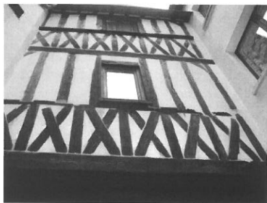
Fig. 88 : 62 rue de la Charpenterie (1466 ?), coursières situées dans la cour et reliant les étages des deux corps de bâtiment

A l'intérieur des maisons, l'espace pouvait être divisé en plusieurs pièces par des cloisons en pan-de-bois ou constituées de planches 31 . Ces planches étaient simplement disposées les unes à côté des autres ou dans les demeures plus luxueuses, assemblées à rainures et à languettes à la manière de lambris 32 . C'est sûrement ce type de cloisons qui existaient dans la maison anciennement 4 rue de la Pierre-Percée à Orléans, dont le cabinet situé au second étage était clos de planches de noyer sculptées de différents motifs (ALIX 2002 : t 1, p. 102).