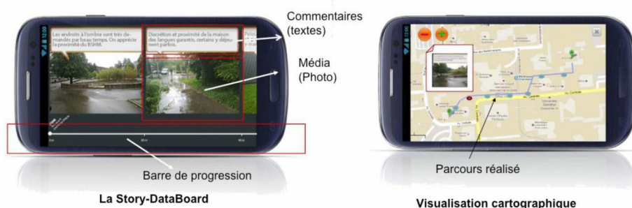
Figure 1 -Récitoire Mobile (Story-DataBoard et Visualisation Cartographique d'un parcours)

L'utilisateur peut visualiser ses contributions et ses trajets sur une carte pour l'ensemble des parcours qu'il a réalisés (voir Figure 1, partie droite).