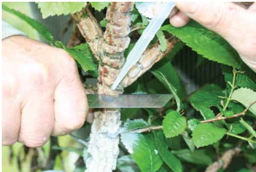
J. Serouigne, Irstea

La stratégie consistant à combiner pragmatiquement approches in situ pour les espèces sociales et ex situ pour les espèces disséminées ou menacées a globalement prouvé sa robustesse mais également montré ses limites. Actuellement la CRGF n'établit plus de distinguo aussi