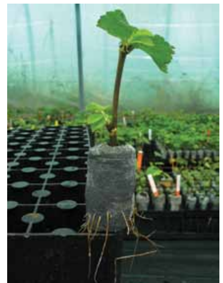
1 - Bouture racinée d'orme sous serre

Les collections anciennes ont été constituées à partir de boutures (photo 1) ou de greffes prélevées sur plusieurs centaines d'arbres adultes échantillonnés dans diverses régions françaises. Leur remultiplication est nettement plus aisée car boutures et greffes peuvent être prélevées sur de jeunes arbres regroupés sur le domaine d'un institut de recherche, à l'exception du noyer dispersé sur plusieurs collections gérées par l'IDF en partenariat avec des propriétaires privés.