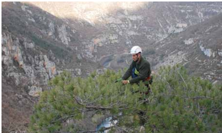
D. Cambon, ONF