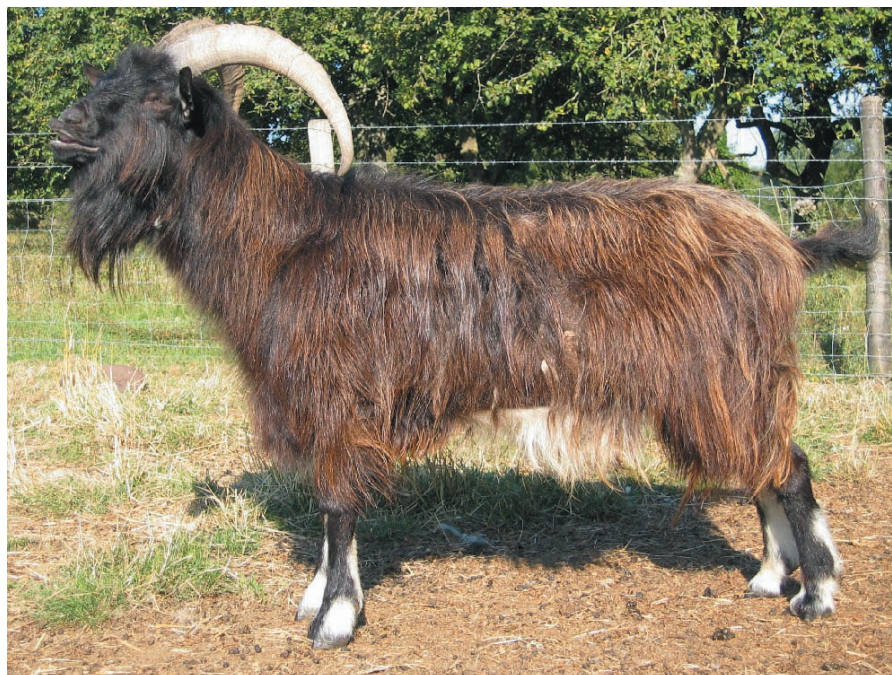
Photo 2. Bouc de race Poitevine.