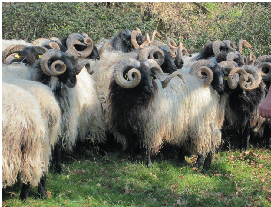
Photo 5. Bœufs de race Manech Tête Noire, l'une des trois races ovines laitières des Pyrénées.

Compte tenu de la faible fécondité des femelles, même avec le recours aux biotechnologies (tableau 4a), le recyclage du progrès génétique, et plus encore sa diffusion, repose principalement sur la voie mâle. Là encore, la maîtrise de l'insémination constitue un atout décisif. En ce qui concerne le recyclage du progrès génétique, l'insémination permet de réaliser exactement les accouplements raisonnés que l'on souhaite, indépendamment de la localisation des animaux. En matière de diffusion, il convient de nettement distinguer les bovins des ovins, les taureaux ayant un très large potentiel de diffusion et les bœufs un potentiel fort modéré, les caprins étant dans une position intermédiaire (tableau 4b). Ainsi, les taureaux d'insémination sont utilisés pour procréer des filles de renouvellement dans les élevages. Chez les petits ruminants, en revanche, c'est essentiellement