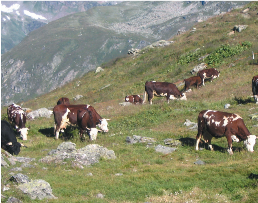
Photo 1. Vaches laitières Valdotaïnes en alpage (Valgrisenche, Italie).