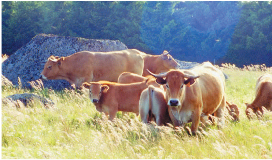
Photo 4. Vaches Aubrac au pâturage.