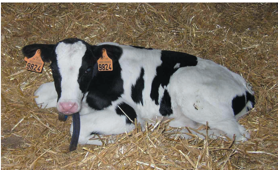
Photo 3. Veau Prim'Holstein avec ses boucles d'identité : l'identification est un préalable à de nombreuses actions zootechniques, notamment l'amélioration génétique.

Les différentes informations collectées sur le terrain (identité, état civil, performances) ou obtenues en laboratoire à partir de prélèvements biologiques effectués sur le terrain (génotype à des marqueurs) sont centralisées, via un réseau de centres régionaux informa-