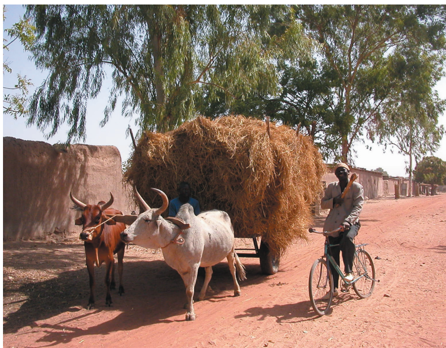
Photo 2. Transport de fourrages à Dentiola (Mali) : les résidus de cultures annuelles permettent d'alimenter le troupeau bovin en saison sèche.

Au sud du Mali, la filière bovine affecte fortement le fonctionnement des