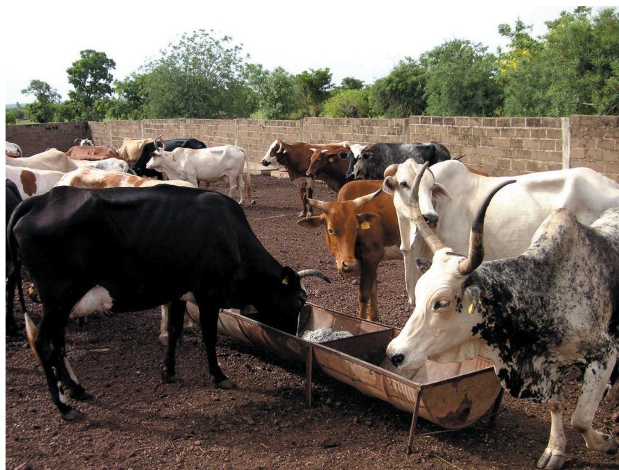
Photo 4. Troupeau laitier en zone périurbaine de Bamako.

Grâce à l'existence d'une filière d'importation de poudre, se développe un grand nombre de petits transformateurs plus ou moins informels, ne travaillant pas ou peu avec la production locale. L'offre de lait cru local correspond mal aux contraintes de la transformation : régularité de l'appro-