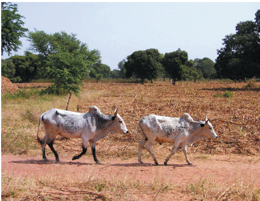
Photo 3. Bœufs en vaine-pâturage à Kanouala (Mali) : une forme d'intégration entre productions végétales et animales à l'échelle du village.

La première force motrice est donc cette demande urbaine en produits