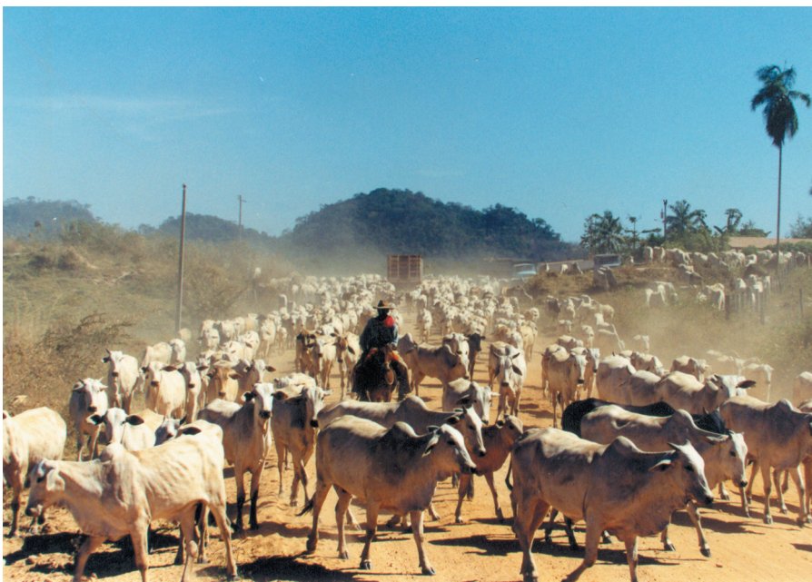
Photo 1. Une boiada, troupeau de jeunes broutards en route vers une ferme d'engraissement, à São Félix do Xingú (Brésil).

La règle des avantages comparatifs détermine l'origine des flux. Les filières, s'affranchissant mieux des contraintes spatiales grâce à la mobilité des produits et des ressources, parviennent à faire jouer à l'échelle mondiale ces avantages comparatifs sur les différents marchés. Des concurrences, voire des substitu-