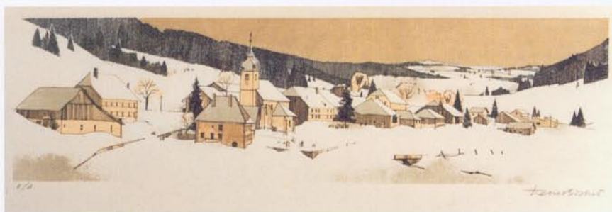
Lithographie 3 - Les Verrières, 1979

En confrontant les travaux de l'Atlas des paysages de Franche-Comté (initié par le CAUE du Doubs et le laboratoire ThéMA) aux lithographies de Pierre Bichet, on obtient une unité de vue assez remarquable. Les lieux sélectionnés par le peintre, traduisant son regard sur l'espace correspondant à sa région, sont tous circonscrits dans deux types paysagers précis définis par les scientifiques (à partir d'une analyse de sources variées et d'outils modernes d'analyse spatiale) : « Jura des grands monts » ou « Jura des grands vaux ». Le regard de l'artiste, au travers de son intuition et de sa pratique des paysages, rejoint ainsi celui des scientifiques ■