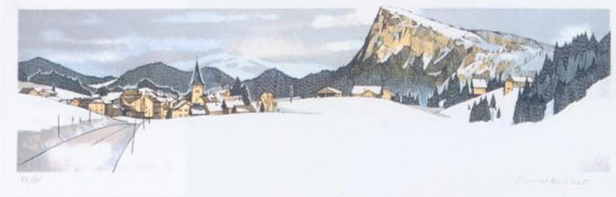
Lithographie 4 - Le Lieu et la Dent de Vaulion, 1989