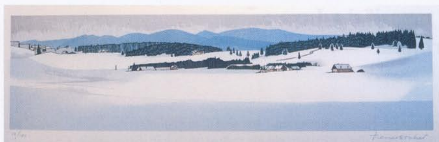
Lithographie 1 - Vers la Clef d'Or (Suisse), 1988

« les villages ont épousé le paysage et s'y inscrivent harmonieusement ». La composition d'une grande partie de ses lithographies est ainsi centrée sur le village, qu'il soit au premier plan (avec un souci du détail qui faisait l'admiration de l'abbé Garneret), en position intermédiaire ou en arrière plan. Le clocher est un symbole fort d'identification et se retrouve très fréquemment (53 %).