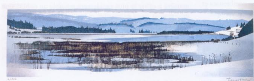
Lithographie 2 - Lac jurassien (Remoray), 1994

Enfin, l'homme lui-même est peu présent (10 %). Il est presque toujours représenté par des enfants, jouant ou marchant dans la neige.