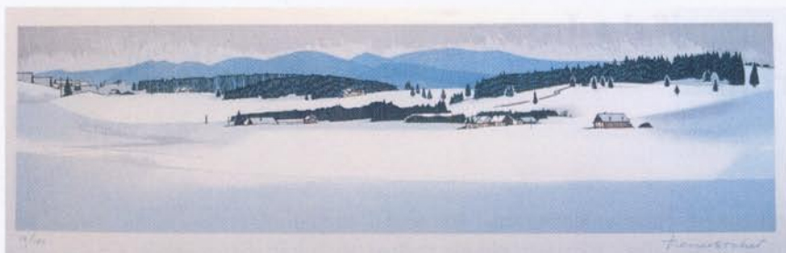
Lithographie 1 - Vers la Clef d'Or (Suisse), 1988

« les villages ont épousé le paysage et s'y inscrivent harmonieusement ». La composition d'une grande partie de ses lithographies est ainsi centrée sur le village, qu'il soit au premier plan (avec un souci du détail qui faisait l'admiration de l'abbé Garneret), en position intermédiaire ou en arrière plan. Le clocher est un symbole fort d'identification et se retrouve très fréquemment (53 %).