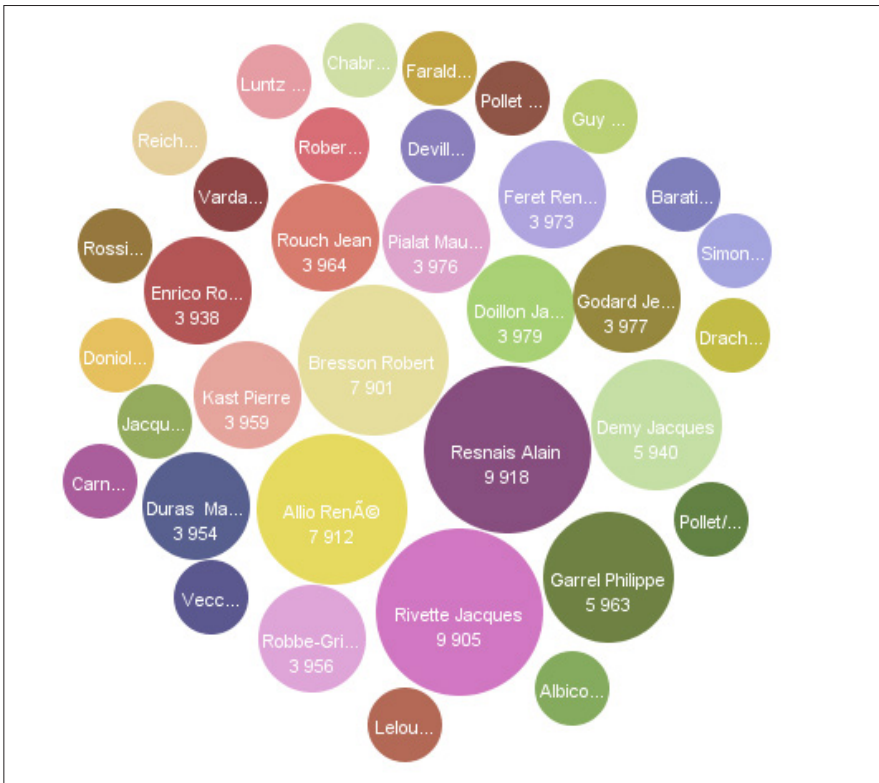
Fig. 3. Corpus des cinéastes ayant tourné plus de 5 films bénéficiaires d'une avance entre 1960 et 1990