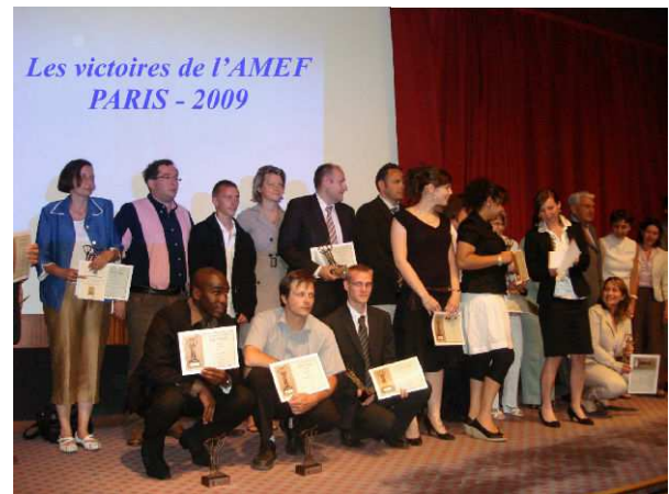
photo. 3 : Les candidats récompensés aux victoires de l'AMEF 2009. Le CFAIURC est sur le podium.

(spécialiste en conception mécanique) nous apporte ses compétences. Après une année de travail confié à un groupe d'étudiants DUT, la société accepte de prendre un apprenti sous contrat BAC+2. A cette époque, nous actons une collaboration forte et pérenne avec le CFAIURC 10 . Cette collaboration impliquait au démarrage les départements GEII et GLT 11 (quelques années plus tard, l'apprentissage sera ouvert à 90% des formations de l'IUT de l'Indre). Malheureusement, l'apprenti ne répond pas correctement à la mission et le projet avance très peu. L'année suivante, nous décidons de renouveler le travail confié avec un nouvel apprenti. En 2009, notre travail est récompensé avec l'industrialisation de la machine spéciale. Cette année restera également une année particulièrement intéressante venant conforter notre approche de travail, car notre apprenti termine 2 ème meilleur apprenti de France au concours : Orientation Alternance de l'AMEF 12 ([1]) (photo. 3).