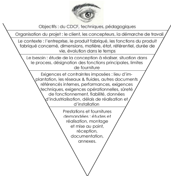
fig. 1 : Une démarche descendante comme Google Earth