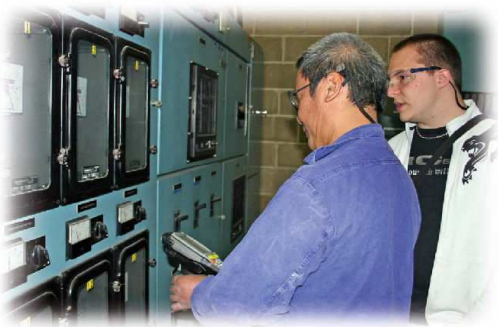
photo. 2 : Tests avec un étudiant lors de la livraison de la solution avec le client final

En 2007, pour répondre à sa problématique de suivi de consommation d'énergie (eau, gaz, électricité, fuite...), l'entreprise castelroussine Arc International Cookware nous confie une mission pour des étudiants en licence professionnelle ARI (Automatismes Réseaux et Internet) de l'IUT. A cette époque, cette société ne disposait pas d'outils performants ni de données centralisées. Notre objectif dans ce dossier était double : simplifier la tâche des techniciens chargés quotidiennement du relevé manuel du suivi de consommations des équipements et optimiser l'exploitation de ces données sous forme de statistiques. La solution développée suite à l'élaboration du CDCF et à la spécification technique du besoin a porté sur deux applications : un programme pour un terminal portable, de type PDA industriel, destiné à effectuer les relevés sur sites et un programme pour poste fixe, dédié à l'analyse des données (photo. 2). La démarche a été couronnée de succès. Les techniciens se sont réellement impliqués dans la démarche en s'appropriant rapidement l'outil. Leur rôle aujourd'hui est de comprendre, détecter les anomalies et d'alerter le plus en amont possible des dysfonctionnements.