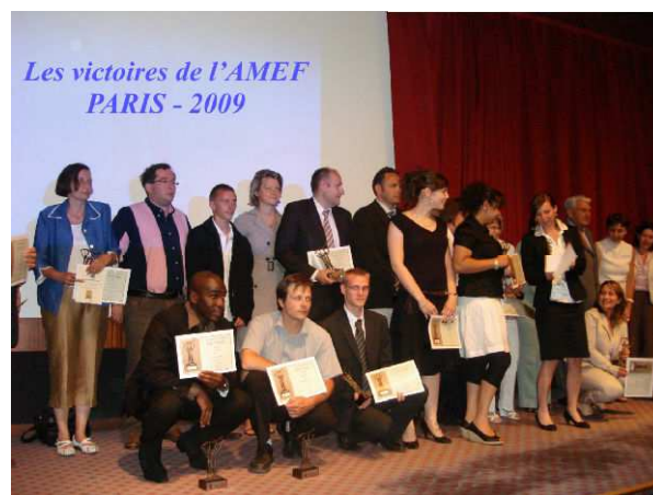
photo. 3 : Les candidats récompensés aux victoires de l'AMEF 2009. Le CFAIURC est sur le podium.

(spécialiste en conception mécanique) nous apporte ses compétences. Après une année de travail confié à un groupe d'étudiants DUT, la société accepte de prendre un apprenti sous contrat BAC+2. A cette époque, nous actons une collaboration forte et pérenne avec le CFAIURC 10 . Cette collaboration impliquait au démarrage les départements GEII et GLT 11 (quelques années plus tard, l'apprentissage sera ouvert à 90% des formations de l'IUT de l'Indre). Malheureusement, l'apprenti ne répond pas correctement à la mission et le projet avance très peu. L'année suivante, nous décidons de renouveler le travail confié avec un nouvel apprenti. En 2009, notre travail est récompensé avec l'industrialisation de la machine spéciale. Cette année restera également une année particulièrement intéressante venant conforter notre approche de travail, car notre apprenti termine 2 ème meilleur apprenti de France au concours : Orientation Alternance de l'AMEF 12 ([1]) (photo. 3).