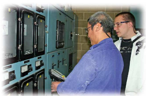
photo. 2 : Tests avec un étudiant lors de la livraison de la solution avec le client final

En 2007, pour répondre à sa problématique de suivi de consommation d'énergie (eau, gaz, électricité, fuite...), l'entreprise castelroussine Arc International Cookware nous confie une mission pour des étudiants en licence professionnelle ARI (Automatismes Réseaux et Internet) de l'IUT. A cette époque, cette société ne disposait pas d'outils performants ni de données centralisées. Notre objectif dans ce dossier était double : simplifier la tâche des techniciens chargés quotidiennement du relevé manuel du suivi de consommations des équipements et optimiser l'exploitation de ces données sous forme de statistiques. La solution développée suite à l'élaboration du CDCF et à la spécification technique du besoin a porté sur deux applications : un programme pour un terminal portable, de type PDA industriel, destiné à effectuer les relevés sur sites et un programme pour poste fixe, dédié à l'analyse des données (photo. 2). La démarche a été couronnée de succès. Les techniciens se sont réellement impliqués dans la démarche en s'appropriant rapidement l'outil. Leur rôle aujourd'hui est de comprendre, détecter les anomalies et d'alerter le plus en amont possible des dysfonctionnements.