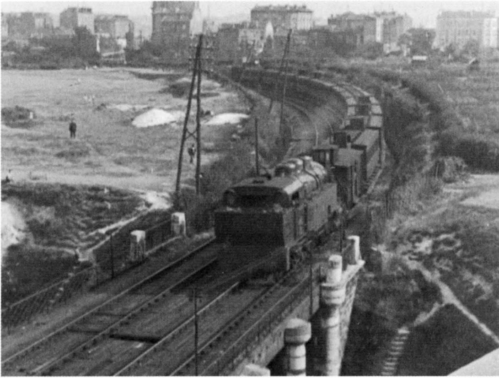
Photogrammes extraits du film d'André Sauvage

Étude « petite ceinture » 37 min 22 secondes