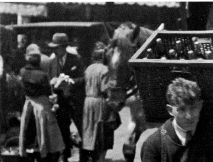
Étude « Nord-Sud » 37 min 34 secondes