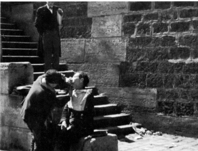
Étude « Paris-port » 19 min 58 secondes