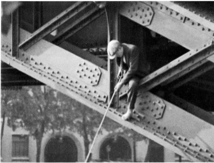
Étude « îles de Paris » 54 min 20 secondes