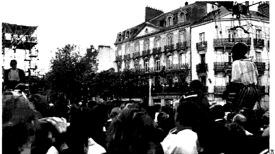
Action artistique de la compagnie Royal de Luxe : « Retour d'Afrique », du 26 au 28 juin 1998 à Nantes.

ment de l'entre-privé, ou l'aire des observables réciproques. Il est aussi objet de jeu, de dramatisation, de plaisir et d'expression des individus et des groupes. Cinquième caractère de l'espace public, son potentiel esthétique est de plus en plus exploité par les artistes et scénographes urbains mais aussi par certains citoyens-artistes. Les nouvelles formes de l'art urbain font bouger non seulement la définition de l'espace public mais aussi celle de l'art 4 . D'un côté, l'art « hors les murs » 5 montre de plus en plus ses vertus : le mixage des arts canonicquement distincts, l'impertinence par rapport à l'institué, la capacité à jouer avec les postures sociales, la bousculade des habitudes, la transgression des attendus, la négation du réel routinier au profit de la fête des sens. D'un autre côté, rarement indemne de la crise à la fois physique et sociale qui affecte le milieu urbain, le créateur y voit son inspiration et ses règles de création sérieusement modifiées. Il y gagne en retour d'être revivifié, d'être en mesure de produire un « art vivant » 6 .