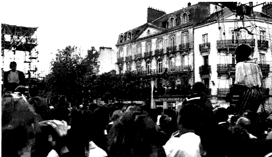
Action artistique de la compagnie Royal de Luxe : « Retour d'Afrique », du 26 au 28 juin 1998 à Nantes.

ment de l'entre-privé, ou l'aire des observables réciproques. Il est aussi objet de jeu, de dramatisation, de plaisir et d'expression des individus et des groupes. Cinquième caractère de l'espace public, son potentiel esthétique est de plus en plus exploité par les artistes et scénographes urbains mais aussi par certains citoyens-artistes. Les nouvelles formes de l'art urbain font bouger non seulement la définition de l'espace public mais aussi celle de l'art 4 . D'un côté, l'art « hors les murs » 5 montre de plus en plus ses vertus : le mixage des arts cano- niquement distincts, l'impertinence par rapport à l'institué, la capacité à jouer avec les postures sociales, la bousculade des habitudes, la transgression des attendus, la négation du réel routinier au profit de la fête des sens. D'un autre côté, rarement indemne de la crise à la fois physique et sociale qui affecte le milieu urbain, le créateur y voit son inspiration et ses règles de création sérieusement modifiées. Il y gagne en retour d'être revivifié, d'être en mesure de produire un « art vivant » 6 .