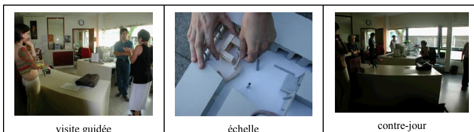
Extrait d'une séance de travail in situ dans le cadre du réaménagement d'un hall d'accueil.

prendre racine. Les observations et les enquêtes qualitatives fondent ici un matériau premier. Ce qui nous paraît important dans cette exploration attentive aux phénomènes est qu'il faut sans cesse resituer les qualités repérables (ou disqualifications) à des pratiques aussi modestes soient-elles.