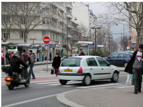
Place du Docteur Girard Maîtrise formelle et négociation informelle

Un espace dense matériellement où le piéton se fraye son chemin en prêtant attention à ce qui l'entoure. Cette avenue, avec ses commerces, n'en est pas moins fréquentée sur les modes de la fonctionnalité et de la flânerie.