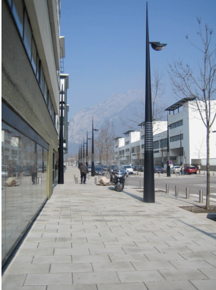
Rue Doyen Louis Weil Mobilité fonctionnelle et confort déserté

Nous nous limitons ici à présenter trois exemples illustrant des cas de figure différents relatifs à la question posée.