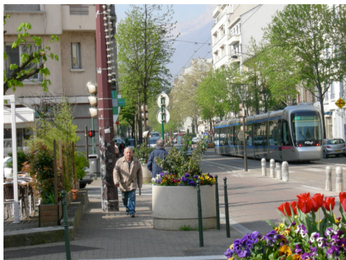
Avenue Maréchal Randon Contrainte aménagée et vie de quartier

Un espace lisse, dédié à la marche (larges trottoirs, absence d'obstacle, surface plane, continuité...). Exemple type d'aménagement piéton des villes favorisant une mobilité fonctionnelle mais dépourvu d'attractivité.