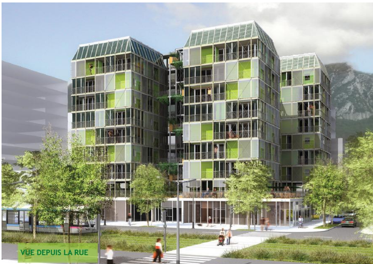
Canopea® : des nanotours dans un éco système urbain. Simulation sur un îlot urbain à Grenoble. (Ch. De Tricaud, A.Messa, PFE A&CC juin 2011)

Quelle densité est alors vraiment tolérable ? Quelles formes urbaines sont adaptées à cette densité ? Quels types architecturaux permettent une intégration dans l'écosystème de manière à maximiser les performances tout en préservant la mixité sociale, l'accès équitable aux services et l'intimité des individus ? Quelles sont les bonnes distances perceptives avec autrui ? Quelles matières et matériaux sont utilisables pour atteindre les niveaux de performances envisagés tout en participant à la création d'ambiances stimulantes et appropriées aux usages ? Quelle présence symbolique et quel rôle climatique, sonore, visuel le végétal doit-il remplir dans cet environnement construit ? Quels systèmes constructifs et quelle organisation de chantier sont les plus adaptés pour réaliser ces assemblages complexes tout en restant économiquement compatibles avec les moyens du plus grand nombre ? Quels dispositifs d'aide peut-on envisager pour permettre aux plus démunis d'accéder à ces logements afin de satisfaire ce droit élémentaire qu'est celui de l'abri ? Toutes ces questions orientent de manière fondamentale notre proposition qui, globalement, interroge l'avenir des milieux de vie des établissements humains.