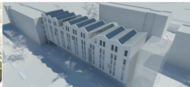
Image de gauche, Canopea® : des nanotours dans un éco système urbain., Simulation sur un îlot urbain à Grenoble., (Ch. De Tricaud, A.Messa, PFE A&CC juin 2011).