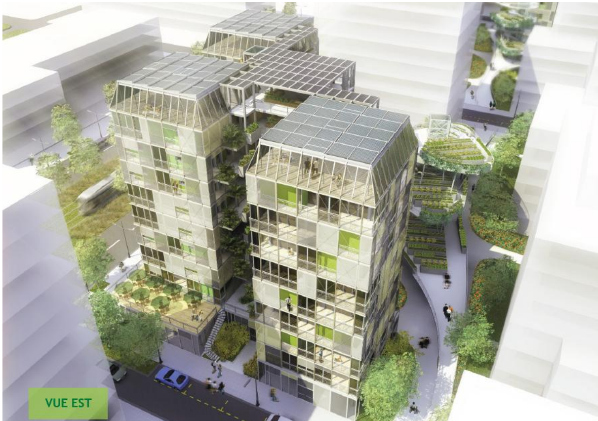
Canopea® : des nanotours dans un éco système urbain. Simulation sur un îlot urbain à Grenoble. (Ch. De Tricaud, A.Messa, PFE A&CC juin 2011)

Ces hypothèses ont amené l'équipe à développer le concept « Canopea® », nanotour solaire regroupant verticalement une dizaine de logements inscrits dans un écosystème urbain avec lequel elle entretient une série d'échanges de flux et de services, disposant de systèmes techniques actifs de maintien du confort thermique et proposant des espaces de vie pouvant permettre à l'habitant de régler les perceptions du voisinage et favoriser l'appropriation.