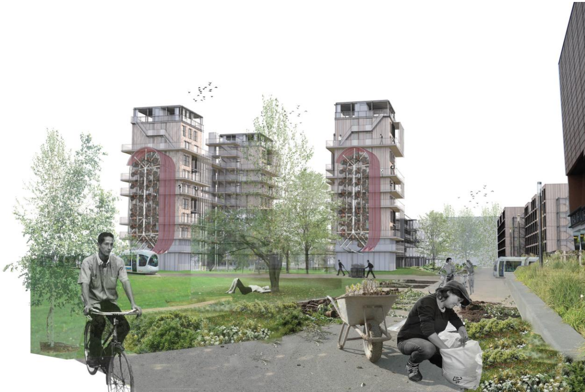
Nanotours d'étudiant, site de Jussieu, CROUS Lyon/Saint-Etienne. Simulation pour la densification de la cité universitaire à Villeurbanne dans le Rhône (M.Lucia D'Alessio, Florence Declaveillère, Yza Hunsinger, PFE AA&CC juin 2012)

étape a déjà été franchie pour Canopea® VAP à travers la modification du PLU de Villeurbanne pour augmenter la densité.