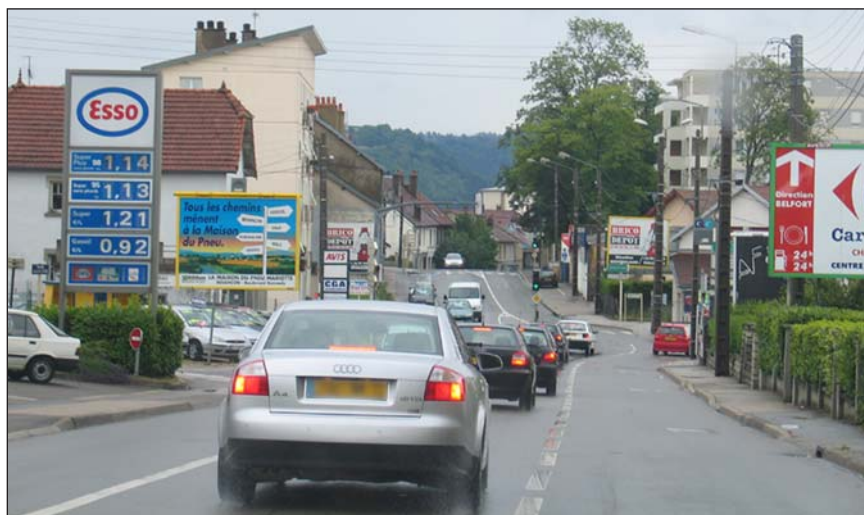
Photo 1 - Une entrée de ville dégradée empruntée quotidiennement par des dizaines de milliers d'automobilistes.

contre une ségrégation excessive des espaces urbanisés (Photo 2).