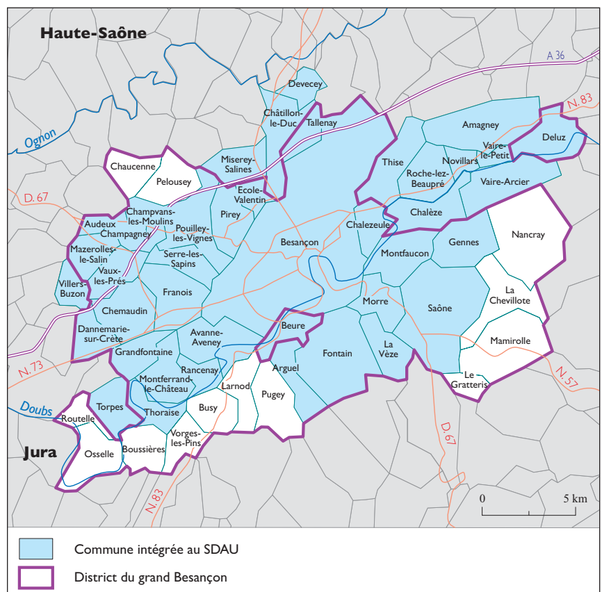
Fig. 1 - Le SDAU et le District du grand Besançon

En ce qui concerne le territoire, le SDAU réunit en 1994, au moment de sa révision, 41 communes réparties, outre la ville de Besançon, en six secteurs géographiques, c'est-à-dire exactement le même nombre de communes qui forment le District du grand Besançon