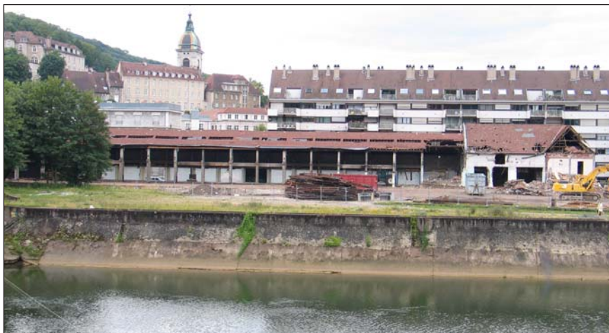
Photo 2 - La reconstruction de la ville sur elle-même préconisée par la loi SRU : la friche du port fluvial est située au coeur du centre historique. (Cliché : Vincent Lemerrier)

La dimension spatiale du territoire est ainsi fortement déterminée par le contexte général, mais aussi par les dispositions législatives relatives certes à la planification urbaine proprement dite mais aussi à l'aspect opérationnel intercommunal. Le mérite de cette évolution n'est-il pas de mettre en contact des responsables territoriaux qui s'ignoraient jusqu'alors pour tracer les grandes lignes d'un projet partagé ? ■