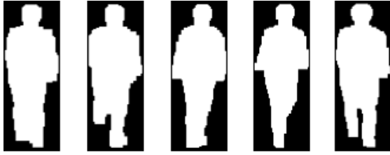
Figure 1. Silhouettes binaires prétraitées.