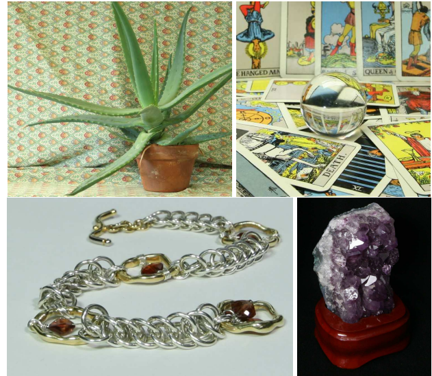
FIGURE 2 – De gauche à droite : l’image “ aloe ” du jeux de données [6], puis “ tarot ”, “ bracelet ” et “ amethyst ” du jeux de données [14].

Pour comparer les résultats obtenus avec la vérité terrain, nous avons utilisé deux mesures de l’état de l’art. Le “ Peak Signal to Noise Ratio ” (PSNR), exprimé en dB, est largement utilisé dans la littérature. Plus le PSNR est grand, meilleur est le signal. Sa valeur est représentative de la qualité du signal mais ne peut pas être considérée comme une mesure objective de la qualité visuelle d’une image, puisque le calcul se fait pixel à pixel. La mesure “ Structural SIMilarity ” [15] (SSIM) a été développée pour mesurer la similarité de structure entre deux images. L’hypothèse est que l’œil humain est plus sensible aux changements dans la structure de l’image, plutôt qu’à une différence pixel à pixel. Pour évaluer nos expériences nous utilisons une distance basée sur la SSIM : DSSIM = \frac{1-SSIM}{2} . Sa ma-