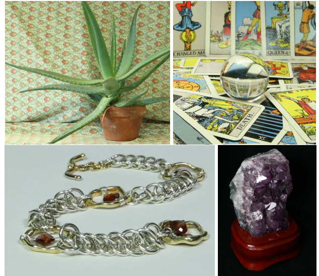
FIGURE 2 – De gauche à droite : l’image “ aloe ” du jeux de données [6], puis “ tarot ”, “ bracelet ” et “ amethyst ” du jeux de données [14].

Pour comparer les résultats obtenus avec la vérité terrain, nous avons utilisé deux mesures de l’état de l’art. Le “ Peak Signal to Noise Ratio ” (PSNR), exprimé en dB, est largement utilisé dans la littérature. Plus le PSNR est grand, meilleur est le signal. Sa valeur est représentative de la qualité du signal mais ne peut pas être considérée comme une mesure objective de la qualité visuelle d’une image, puisque le calcul se fait pixel à pixel. La mesure “ Structural SIMilarity ” [15] (SSIM) a été développée pour mesurer la similarité de structure entre deux images. L’hypothèse est que l’œil humain est plus sensible aux changements dans la structure de l’image, plutôt qu’à une différence pixel à pixel. Pour évaluer nos expériences nous utilisons une distance basée sur la SSIM : DSSIM = \frac{1-SSIM}{2} . Sa ma-