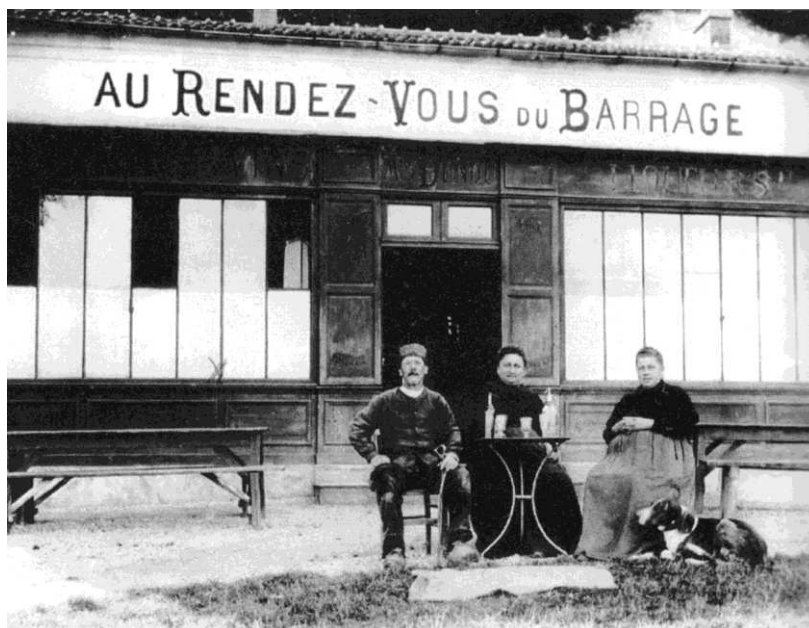
Fig. 2. Au Rendez-Vous du Barrage