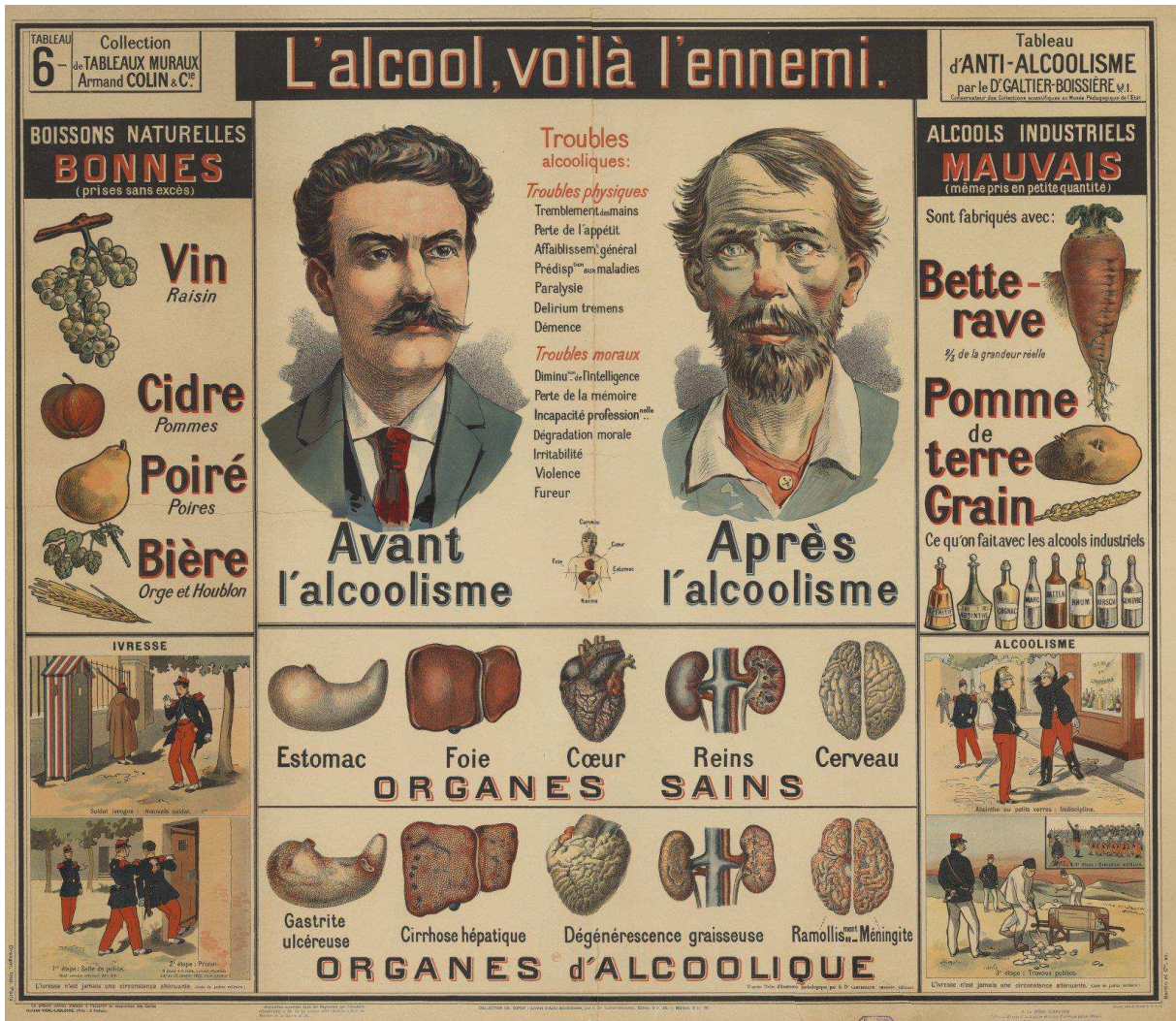
Fig. 4. L'Alcool, voilà l'ennemi , tableau mural (100 x 120 cm), Armand Colin, 1900.

Chez Villemot (et non Villemont, comme l'écrit Jarry), on monte en grade en buvant – ce qui tendrait à confirmer l'hypothèse selon laquelle Jarry aurait appris à boire dans l'armenderre. Mais Jarry n'atteint pas l'absolu qu'il s'était fixé, une méningite tuberculeuse mettant fin à sa quête de la Dive Bouteille.