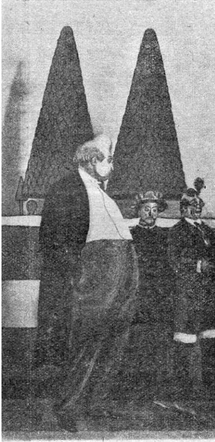
Fig. 2. Gémier en 1908 dans le rôle d’Ubu.

Comme le note Henri Béhar, c’est le bourgeois le plus contemporain : « Il rote, chie et pisse sur scène sans perdre de sa dignité 15 » ; la scène du passage à la trappe des Magistrats et Financiers (III, 2) devient une sorte de thé dansant ; tout est dans le décalage, le propos restant assez simple : notre société policée cache une violence profonde.