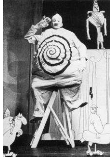
Fig. 4. Ubu à Stockholm.

Saluée par les critiques, cette traduction connaît une tournée internationale — le succès étant très lié aux décors de F. Themerson, qui réinvente les dessins jarryques ; on retrouve le même genre de pratique dans l’adaptation télévisuelle de Jean-Christophe Averty.