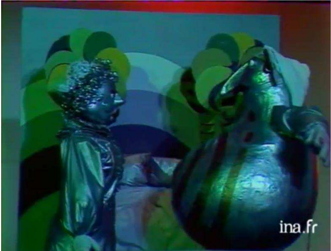
Fig. 5. Le couple Ubu selon le Petit Théâtre de Marionnettes de Nantes.

Cette volonté de se rapprocher de l'origine fait finalement plus penser au Muppet Show qu'à une tentative subversive... Le principe d'une restauration d'une telle pièce ne fonctionne pas, parce qu'il est en soit paradoxale : patrimonial et historique quand il s'agit de monter une pièce soit disant choquante.