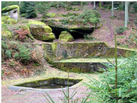
Fontaine de Guéry