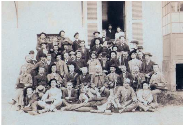
Excursion à Celles sur plaine du 25 mai 1894