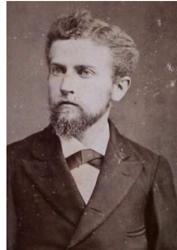
Photographie de Jean-Paul Vuillemin © Archives J. P. Vuillemin

naturelle médicale à la Faculté de médecine de Nancy, et un an plus tard seulement, il fait son entrée dans le monde scientifique.