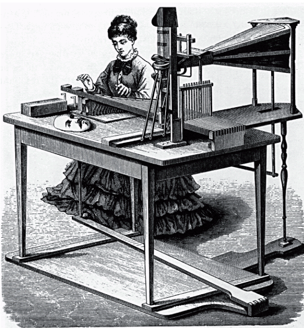
Figure 1. Euphonia.

est produit par une machine ; le phonographe a ouvert la voie à cette expérience de pensée niant le caractère divin de nos paroles, et mettant en crise les représentations. Son invention monstrueuse, « une gorge géante, distendue et grivelée, avec des repris de peau noire qui pendaient et se gonflaient, un souffle de tempête souterraine, et deux lèvres énormes qui tremblaient au-dessus », reliée à un clavier actionné par une assistante, prononce des paroles « sans nuances » et sans âme, apothéose de la mécanisation de la voix, coupée de tout contexte humain. La Machine à parler est un phonographe sans