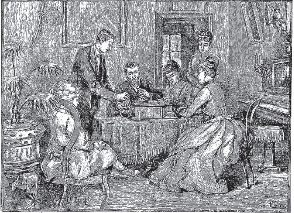
Figure 2. Une audition du nouveau phonographe Edison.

Le texte de Jarry se réapproprie ce symbole 5 ; « Phonographe » est lui-même une machine à produire du sens, un texte synthétique à redéployer. La question centrale de ce poème en prose est celle de la communication littéraire, que Jarry voit essentiellement comme une forme de décervelage : l'imposition par autrui d'une pensée dans la cervelle de son lecteur.