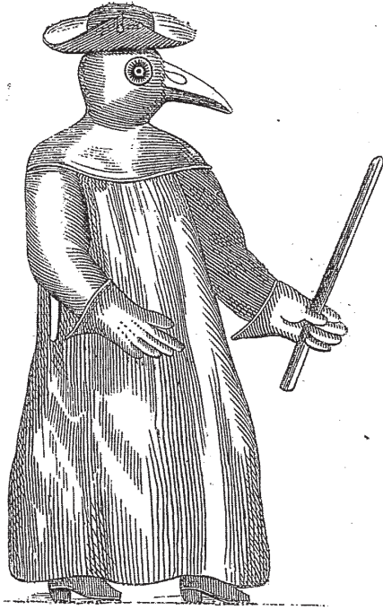
Figure 3. « Habit des médecins et autres personnes qui visitent les pestiférés », Le Magasin pittoresque , 1841, p. 120.

Sous cette gravure, qui sert de frontispice au Traité de la peste (1721), sont les lignes suivantes :