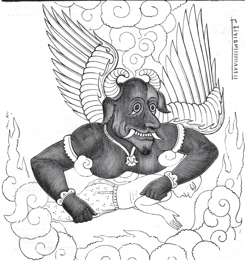
(Djinn appelé Malek-Meymoun , tiré d'un manuscrit turc intitulé : l'Orient du bonheur et la source de la souveraineté dans la science des talismans , par Sidi Mohammed Ben-Emir Haçan el-Saoudi. — Cet ouvrage, composé en 990 de l'hégire (1582 de l'ère vulgaire), a été apporté du Caire et déposé à la Bibliothèque nationale, par le citoyen Monge, au nom du général Bonaparte. — La petite légende verticale qu'on voit à gauche est un talisman pour se préserver des maléfices de ce djinn.)