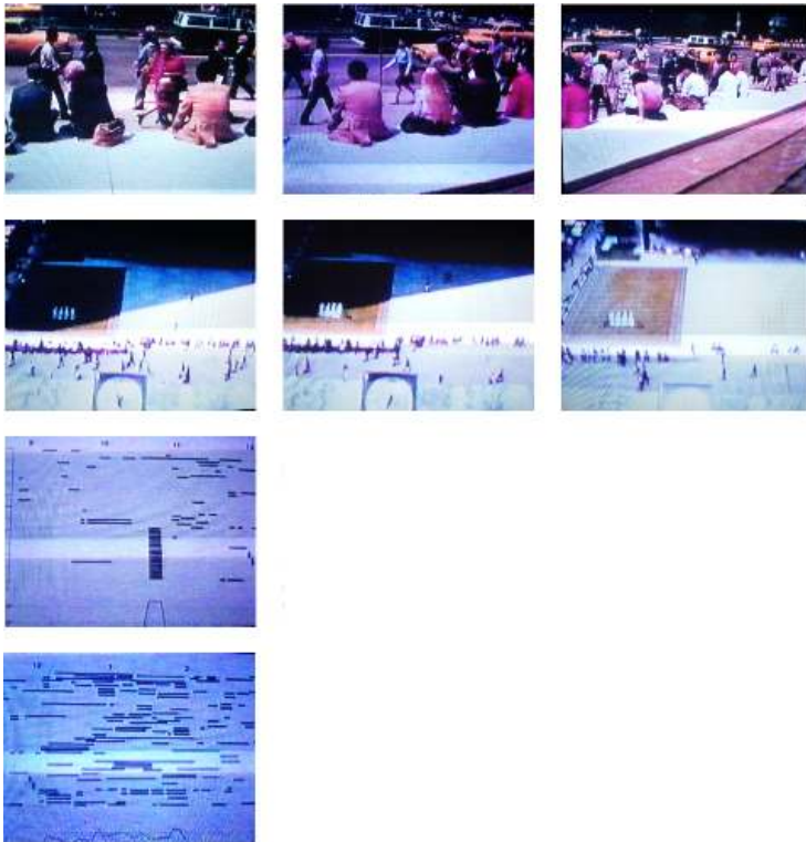
Illustration 1 : The North Front Ledge at Seagram's

Cet extrait vidéo est ici représenté par une série de photogrammes (photographies d'écran) sélectionnés à partir de The Social Life of Small Urban Spaces (Whyte (réal.), 1988), entre 17 minutes et 18 minutes et 16 secondes.