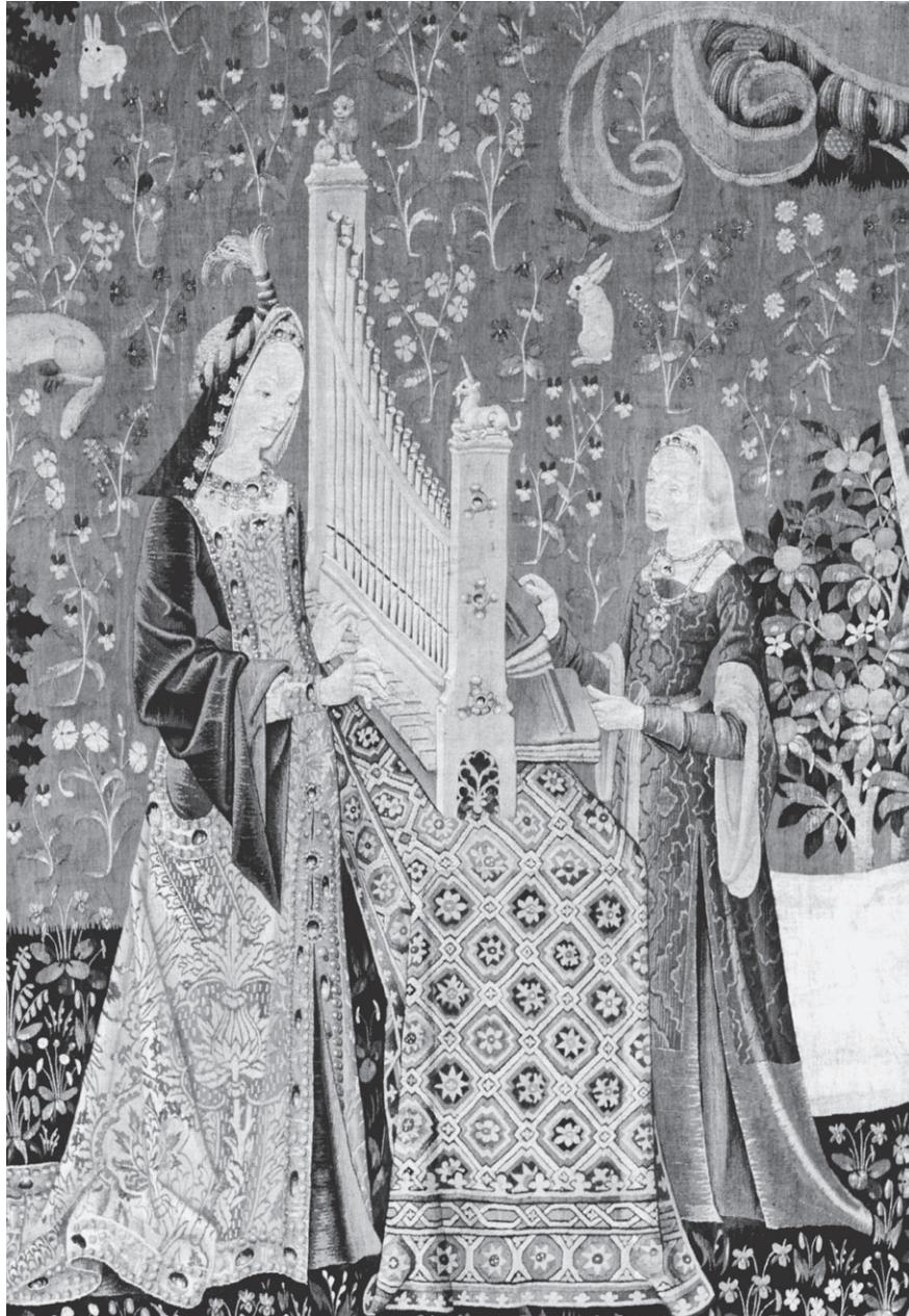
L'ouïe , détail de la tapisserie La Dame à la licorne (fin XV e siècle). Paris, Musée des Thermes et de l'Hôtel de Cluny.

et de description, empirique et local dans un premier temps, a été guidé par les travaux de Jean-François Augoyard sur le vécu sonore, phénomène complexe par nature, peu connu, que l'auteur avait étudié dès l'année 1977.