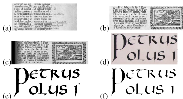
Figure 2. Images obtenues après application de modèles de déformation : (a) image présentant une défaut de transparence ; (b) image sans déformation ; (c) image simulant une déformation due à une reliure (d) image d'origine ; (e) image binarisée ; (f) image avec déformation des caractères

texte et d'illustration. Pour chaque bloc, il est possible de définir la fonte à utiliser, les règles de position des caractères les uns par rapport aux autres... Pour la page dans sa globalité, il est possible de définir le fond utilisé ainsi que les modèles de défauts à appliquer. Il est possible, à l'aide d'une interface graphique, de créer des documents anciens semi-synthétiques. Pour chaque image est généré un fichier XML dans lequel est stocké l'ensemble des informations contenues dans l'image. Ces informations sont de deux niveaux différents. Le premier est lié à la structure de la page générée (positions des caractères et leur label, espace interligne, nom de la fonte utilisée, ...). Le deuxième niveau d'information est lié aux défauts (locaux ou globaux) utilisés pour générer l'image.