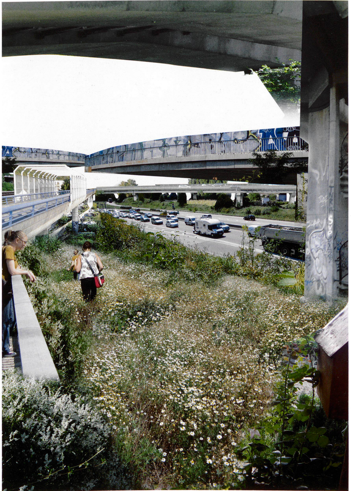
1 Fotomontage: Natur am Strassenrand. Photomontage: La nature au bord de la route.

Walter Simone (à partir des photographies de Grégoire Chelkoff et Magali Paris)