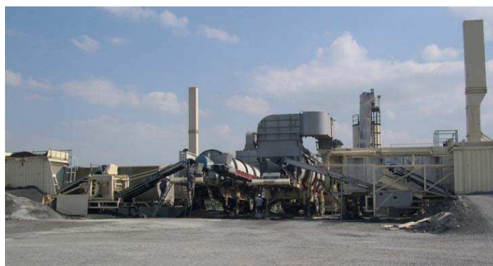
Figura 2. Central de mistura asfáltica com dois tambores separados modelo Benninghoven (campo de reciclagem a taxas elevadas em um EME em autopista no norte da França)

As últimas gerações de usinas permitem elevadas taxas de reciclagem e altas capacidades. Assim, depois de 2 a 3 anos, para satisfazer a demanda das pistas experimentais, as empresas se equiparam de algumas centrais móveis (em torno de uma dezena de unidades) de uma capacidade importante de 300 a 400 t/h, munidas de dois tambores para realizar as reciclagens à taxas elevadas. As misturas a reciclar são secas e preaquecidas até cerca de 120°C em um tambor paralelo funcionando como um TSE equi-corrente e enviados ao misturador. Paralelamente, os agregados virgens são superaquecidos à temperatura razoável (200°C) em um tambor secador à contra-corrente (clássico). Depois da dosagem, eles são enviados ao misturador e homogeneizados com o reciclado e com o ligante novo adicionado. Neste tipo de instalação, as taxas de reciclagem são em torno de 40 a 70% (com agregados secos).