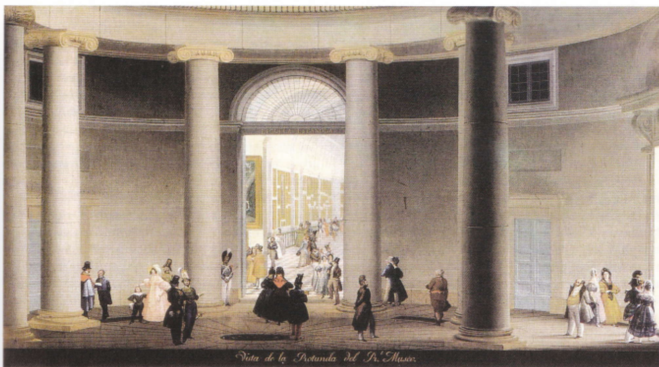
16. Rotonda del Museo del Prado / El Prado Museoko Errotonda