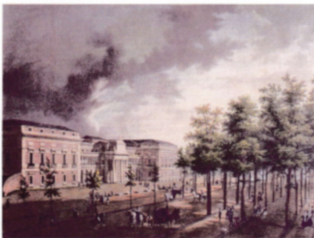
15. Museo del Prado / El Prado Museoa

Para él, no se trata de devolver a la nación un patrimonio que le pertenece, sino de permitir a sus vasallos que contemplen los mejores cuadros de las colecciones reales, en un museo que pertenece por completo a la Casa Real. Pero, a pesar suyo, Fernando VII inicia un proceso irreversible, y con el paso del tiempo, se irá imponiendo la conciencia de que estos cuadros no pueden ser patrimonio privado del monarca, ni siquiera patrimonio de la Corona, y el Real Museo del Prado acabará convirtiéndose en Museo Nacional del Prado en 1869.