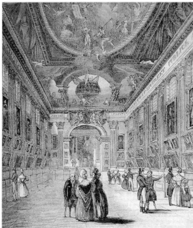
14. Museo en Greenwich / Museoa Greenwichen

dad? ¿Por curiosidad? ¿Con el afán de aprender? ¿Con el ánimo de divertirse? ¿Alguien les incitó a conocer el museo? ¿Deambulaban por el paseo del Prado y les atrajo lo grandioso del edificio? Ya intuimos que el texto de Madrazo no es solamente descriptivo, sino que traduce una forma de exclusivismo: el deseo de una élite de imponer su forma de ver y apreciar los cuadros y las esculturas expuestas en los museos. Intuimos también que la realidad no se adecua completamente a este deseo y que la visita al museo, en el siglo XIX, constituye de hecho, para un público variado, una posibilidad de apropiaciones plurales del arte.