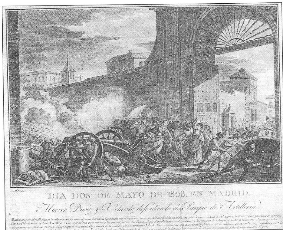
«Día Dos de Mayo. En Madrid. Mueren Daoiz y Velarde defendiendo el Parque de Artillería», gravure de Tomás López Enguñados, 355 x 422 mm.