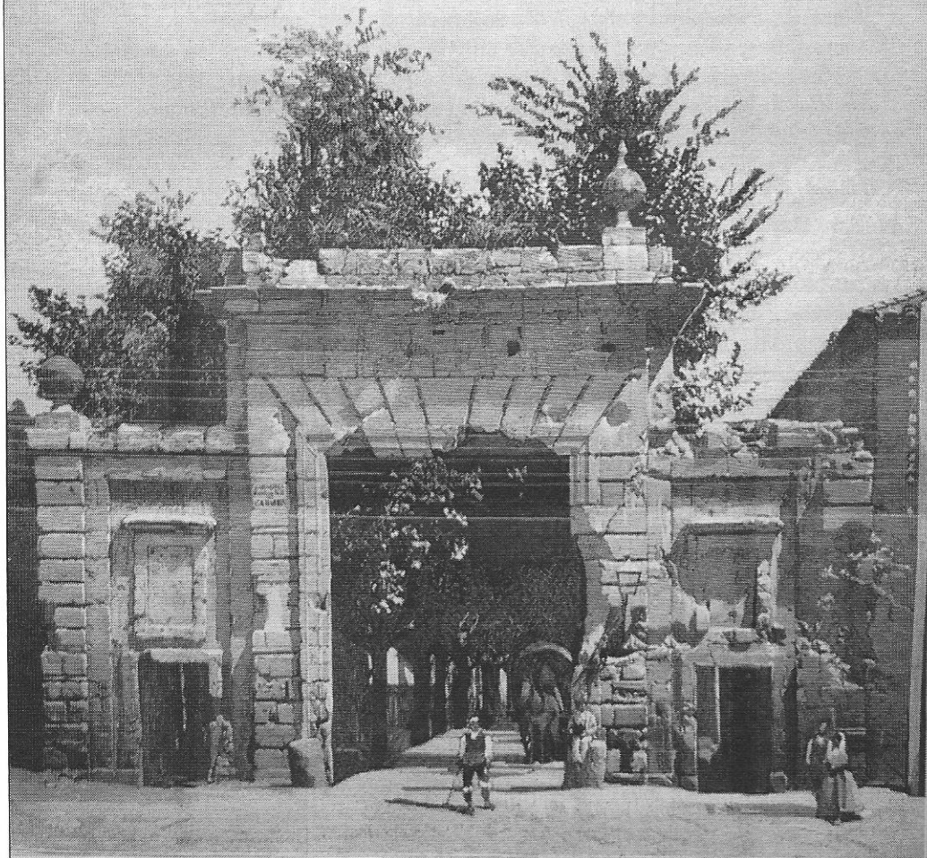
ZARAGOZA. — PUERTA DEL CÁRMEN, BOMBARDEADA POR LOS FRANCÉSES EN LOS DOS CÉLEBRES SITIOS DE 1808 Y 1809.

«Zaragoza. Puerta del Carmen, bombardeada por los franceses en los dos célebres sitios de 1808 y 1809 (fotografía de Laurent)», La Ilustración Española y Americana , 8 mai 1883.