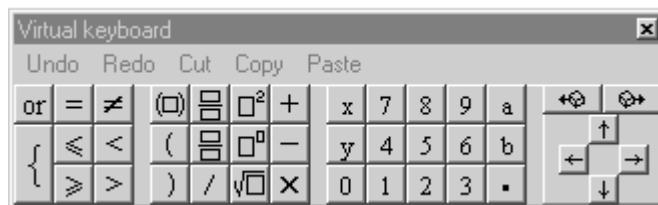
figure 3 : clavier virtuel d'APLUSIX.

Par ailleurs, l'éditeur d'expressions algébriques fournit quelques rétroactions en utilisant des couleurs pour certaines sous expressions d'une expression éditée. Le bleu signifie qu'une sous expression est incomplète ou hors domaine. Le rouge signifie qu'une sous expression est indéfinie (d'un point de vue mathématique) comme 1/0 ou incorrecte du point de vue des types comme x+x ou 1 . Enfin, entre autre à la demande des enseignants utilisant APLUSIX, un clavier virtuel à été ajouté pour faciliter l'appropriation des apprenants qui ont du mal avec le clavier physique et qui préfèrent la souris. Ce clavier virtuel est montré figure 3